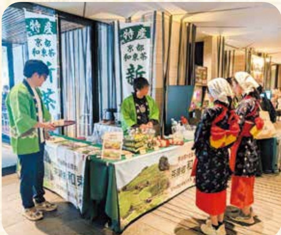
リーガロイヤルホテル京都での和束茶PRの様子

イベント当日には、多くのお客さまがお越しください、和束茶を味わっていただきました。また、国内のお客様のみならず、海外の観光客からもご好評をいただきました。新茶の振る舞いに加えまして、和束町の観光PRも行い、多くの方に和束町を知っていただく機会となりました。