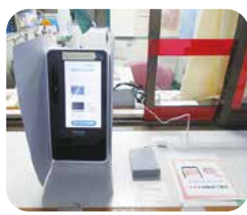
※スマートフォンでマイナ保険証を利用できます

また、令和7年9月19日から「スマートフォンに搭載されたマイナ保険証」でオンライン資格確認ができる機能が全国の医療機関等へ開放されたことを受けまして、本診療所におきましても、患者の利便性向上のため、令和8年1月18日から導入しました。