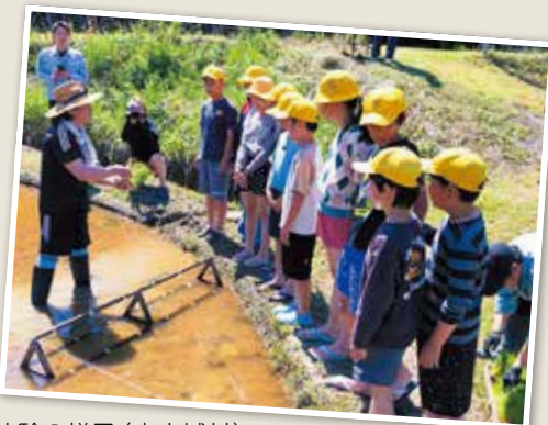
南山城小学校の田植え体験の様子(南山城村)