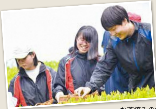
お茶摘みの様子(和束町)

5月7日(木)、わづかこども園・和束小学校・和束中学校でお茶摘みを行いました。 子どもたちは、地域の方や先生と一緒に慣れた手つきで「一芯二葉」を摘み取っていました。 お茶摘みは小・中連携の一環として取り組んでおり、去年に引き続き保育園児も加わりお茶摘みの体験をもとに小・中学校・保育園のつながりが深まったと思います。