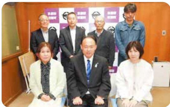
前列左から小谷委員・町長・渡利委員 後列左から北川委員・北口委員・巽委員・滝口委員