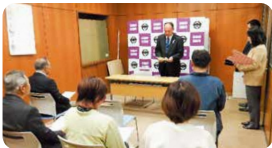
町長から委員への挨拶