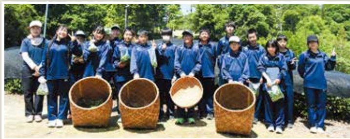
笠置中学校のお茶摘みの様子(笠置町・南山城村)

5月18日(月)、笠置中学校でお茶摘みを行いました。 晴天の中、真剣な顔や楽しそうな姿で「一芯二葉」を摘み取っていました。 子どもたちの楽しんでいる笑顔が見受けられました。