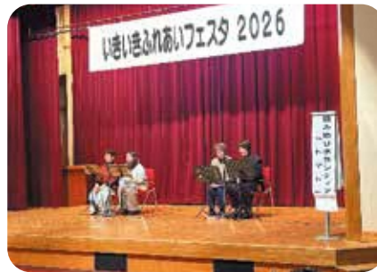
読み語りボランティア「トマト」