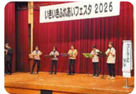
ウクレレサークル レアレア