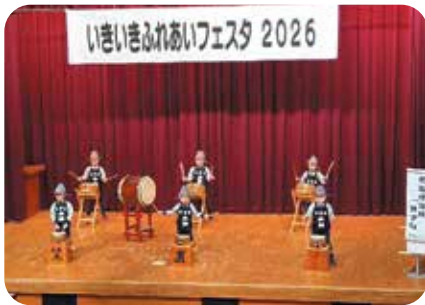
笠置保育所「きずな」