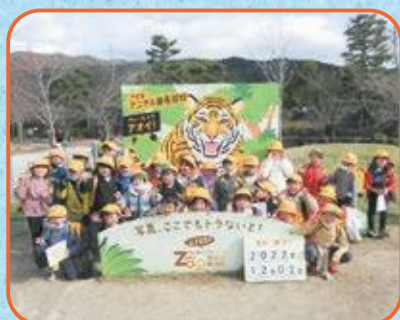
1年生 京都市動物園