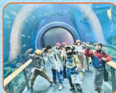
3年生 琵琶湖博物館