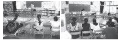
認知症について学ぶ 脳トレーニングの体験

住み慣れた笠置町で、高齢者を温かく見守るキッズサポーターの一員として活躍をしてけると期待しています。