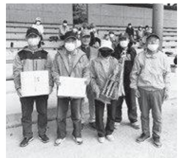
笠置町町長杯GG大会