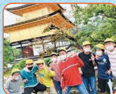
6年生 金閣寺・二条城・佛教大学