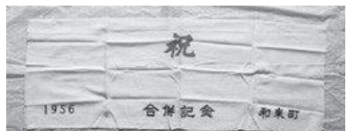
1956年（昭和31年）和束町・湯船村合併記念手ぬぐい

その後、湯船村有林は合併後も湯船財産区有林とすることで話し合いがまとまり、1956年（昭和31年）9月30日湯船村も合併して、現在の和束町が誕生したのです。