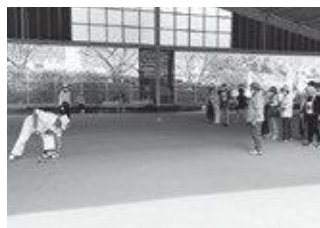
連合教育長杯GB大会