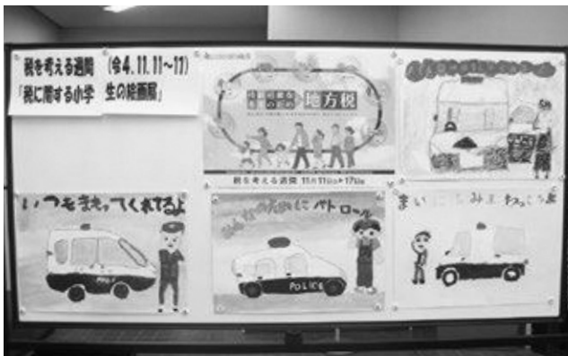
笠置町産業振興会館にて

11月11日(金)～17日(木)までの「税を考える週間」の一環として、笠置町・南山城村の小学校の児童たちが思い思いに描いた絵画作品を展示しました。