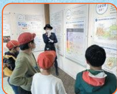
4年生 京都市市民防災センター・文化パルク城陽