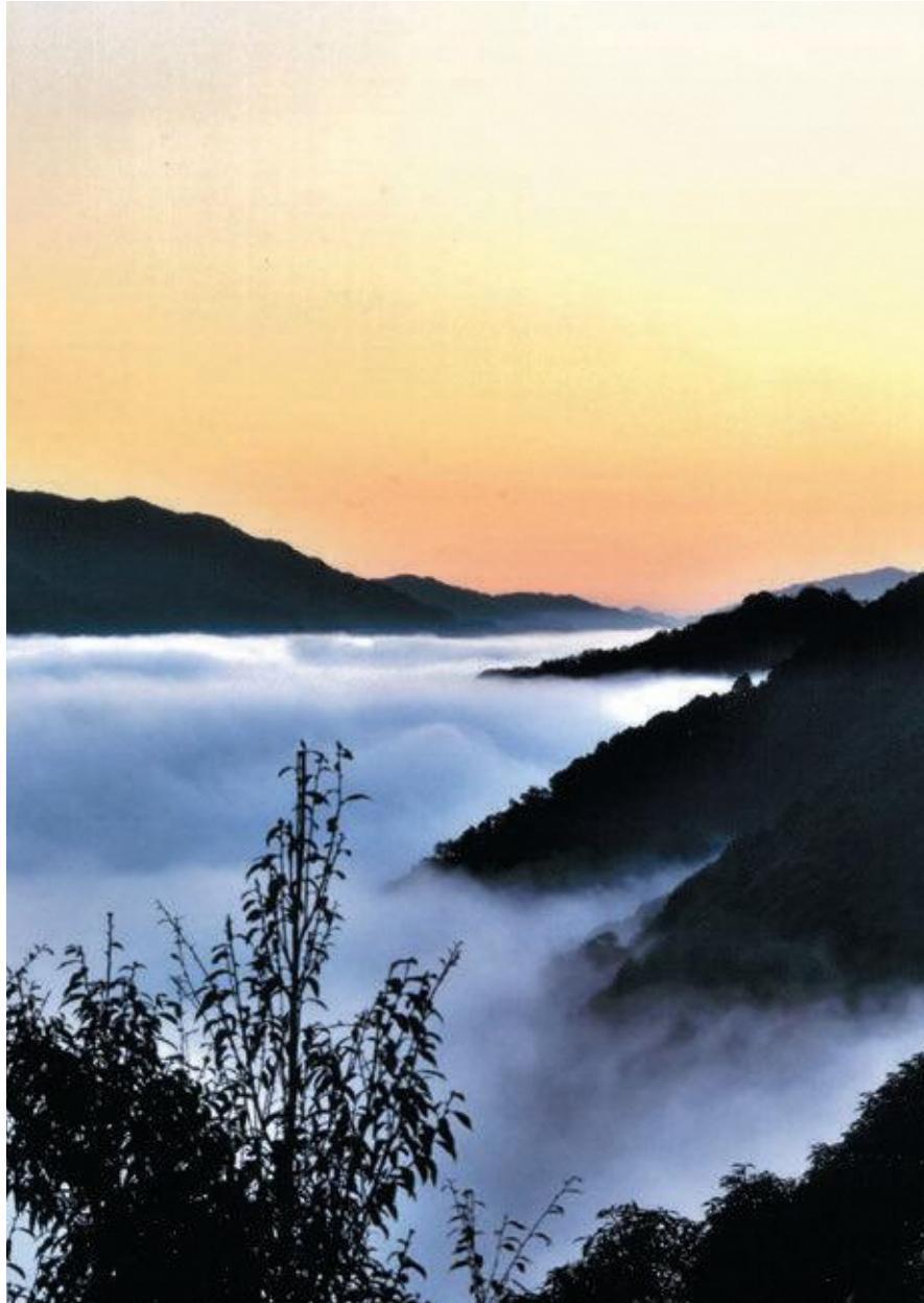
表紙写真：第14回笠置町フォトコンテスト応募作品「-6℃」