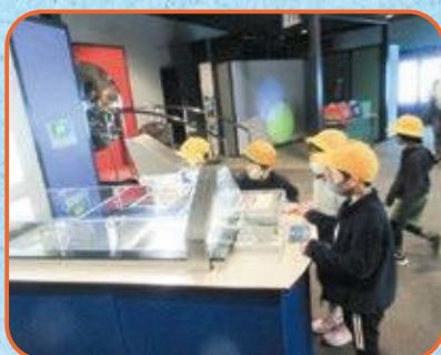
2年生 きつづ科学ふおとん・東大寺大仏殿