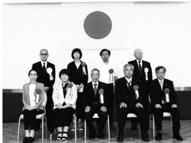
北川委員(前列左から2番目)、森嶋委員(前列中央)