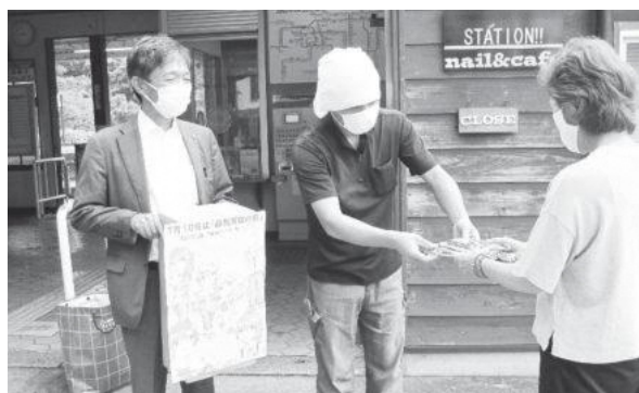
JR笠置駅前での街頭啓発活動