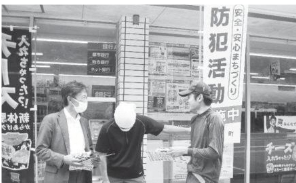
ローソン笠置切山店での街頭啓発活動

7月13日(水)はJR笠置駅前では、15日(金)はローソン笠置切山店にて防犯活動の街頭啓発をおこないました。両日とも中笠置町長が参加され、コロナ対策を講じたうえで、町民や利用者に対して防犯への注意喚起と啓発物品の配布をおこない効果的な取組ができました。 また、12日(火)には、笠置小学校と笠置保育所の子どもたちにも啓発物品を配布するなどの取組もおこなわれました。笠置町では、引き続き犯罪のない安心・安全なまちづくりをめざしてまいります。