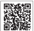
QRコードからもHPにアクセスできます。