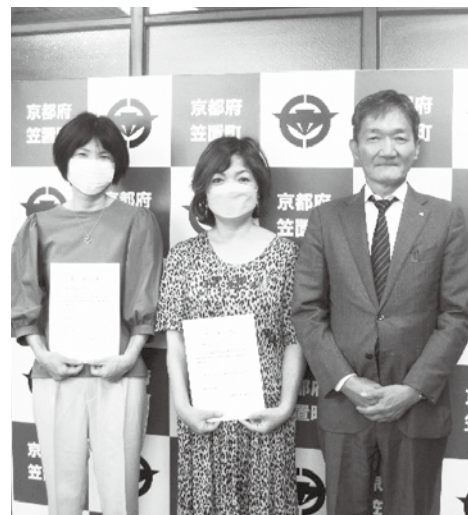
左から渡利委員、浦田委員