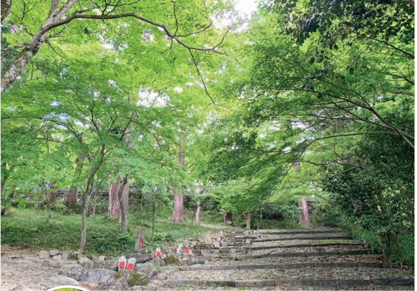
表紙写真：正法寺の青紅葉（和束町）