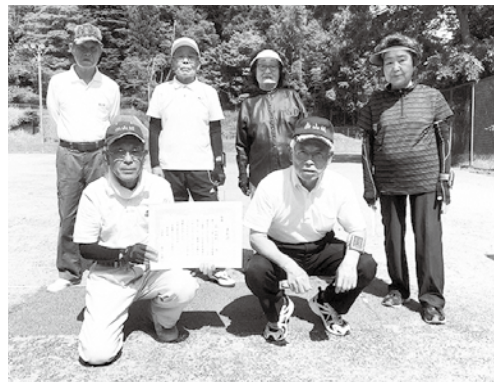
南山城村 本郷きらく会のみなさんとゲートボール連盟 岡崎会長(前列右)