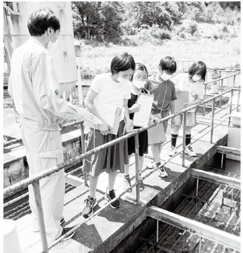
興味津々に見学する児童

見学後「浄水場の施設について詳しく説明してもらい、よくわかりました。いろいろなことをして水をきれいにしているので、水を大事にしなければいけないと思いました。」と感想を述べ、児童たちはこの学習を通して、浄水場が生活に欠かせない水道水をつくる重要な施設であることと、資源である水の大切さを実感していました。