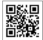
QRコードからも アクセスできます。