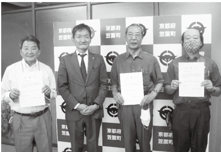
左から宮崎委員、町長、山口委員、谷川委員

新型コロナウイルス感染症の終息目は依然立っていない状況ですが、町内での交通安全対策の検討や啓発活動等について委員のみなさまと協力して取組む予定です。 なお、委員の任期は令和6年3月31日までです。