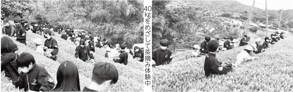
40kgをめざして茶摘み体験中

小中連携の一環として取り組んでいるお茶摘みは、今回の体験をもとに各校のふるさと学習として深め、和束町の主産業であるお茶を中心とした学習で小学校と中学校のつながりをさらに深めていく予定です。