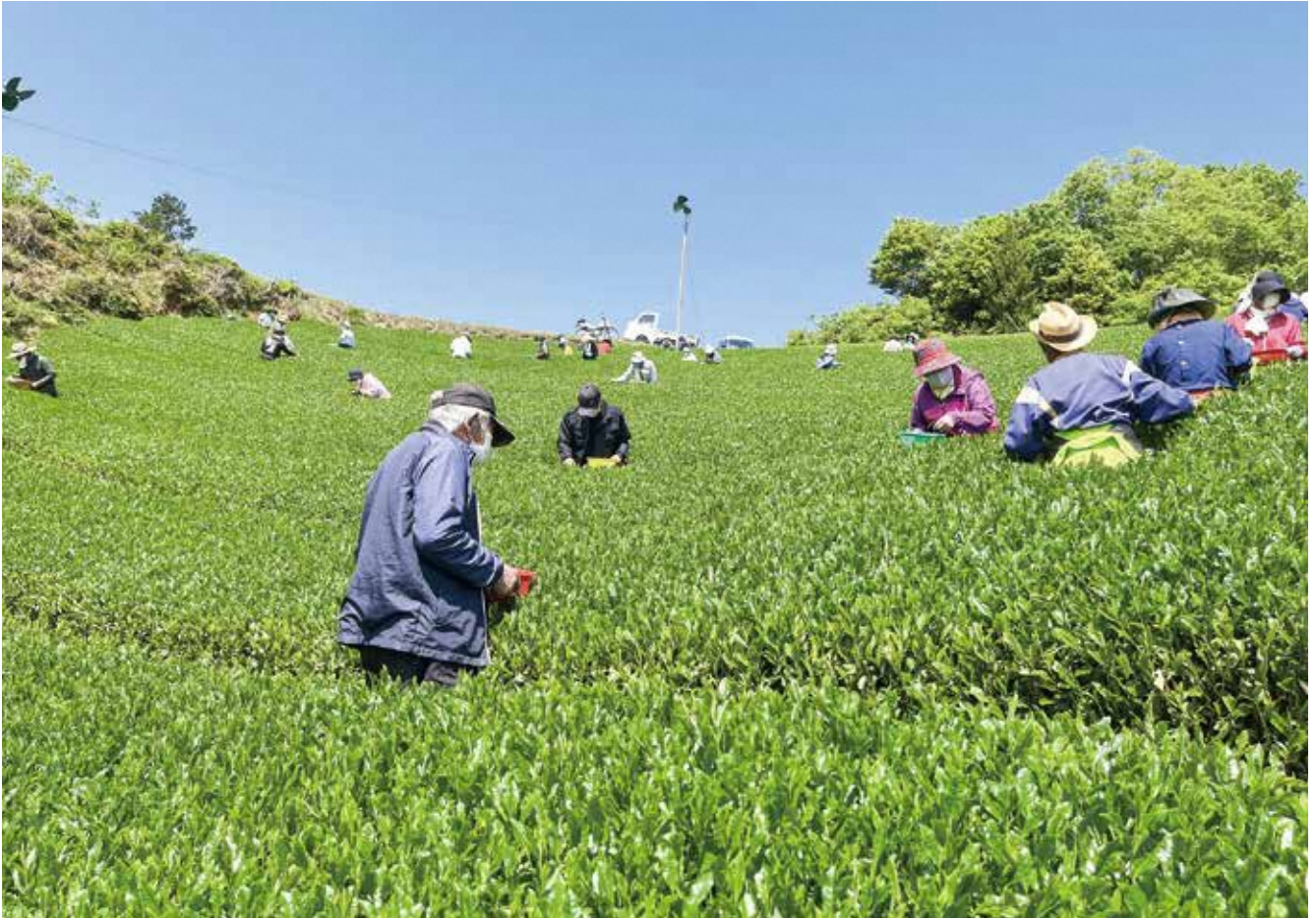
表紙写真：晴天の中でのお茶摘み 南山城村高尾中谷茶園