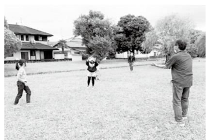
芝生でのボール遊び