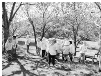
桜の木の下を散策