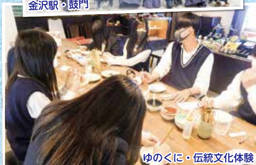
ゆのくに・伝統文化体験