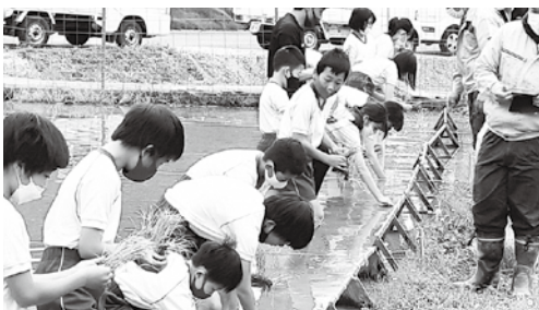
指導のもと、田植え体験中

9月に収穫するお米は、全校児童で味わったり、地域の人にふるまったりする予定です。