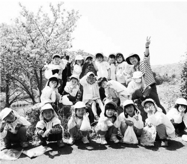
満開の桜の前でみんなでポーズ