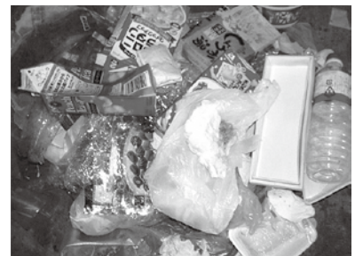
プラスチック容器包装ごみに混ざっていた紙類・ペットボトル類