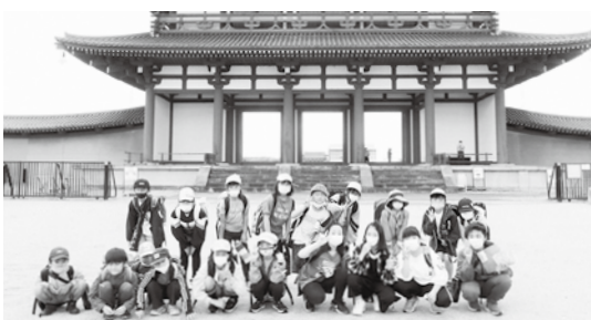
朱雀門での集合写真

生涯学習課では、3町村の子どもたちが積極的に交流できるよう、さまざまな事業を計画していきます。ぜひ、親子で参加ください。