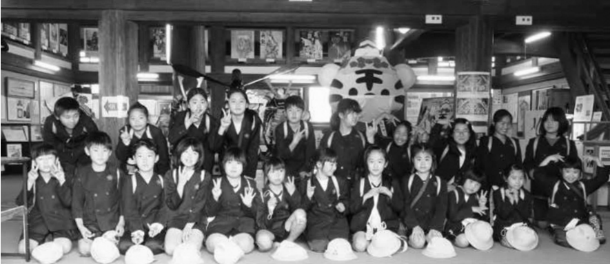
伊賀上野城での集合写真

心配していた雨もなんとか持ち、計画していた内容を全ておこなうことができました。子どもたちのふり返りでは、「お城が大きかった」「忍者屋敷のからくりがすごかった」「や」「なかよし班の友だちと協力したので、仲良くなれた」などの感想を笑顔で発表している姿が印象的でした。どの児童もとても有意義な時間を過ごすことができました。