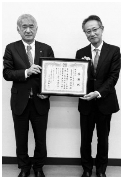
(左から平沼村長、松下代表取締役社長)