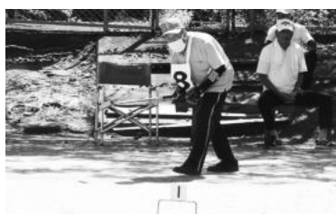
ゲートボール大会(南山城村第2グラウンド)