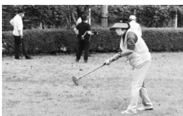
グラウンドゴルフ大会(ダムサイトグラウンド)