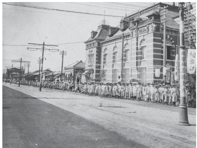
1915年（大正4年）大嘗祭のため京都御所へ材木を運ぶ和東郷行列。京都市三条烏丸で撮影

☎ 0774・74・8952 HP https://www.union.sourakutoubu.lg.jp （和東町史編さん室）