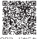
QRコードからも アクセスできます。