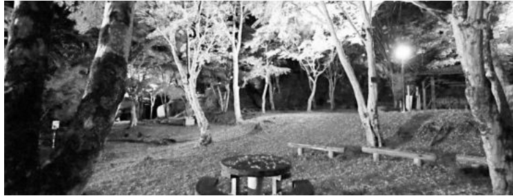
笠置山もみじ公園夜間ライトアップ