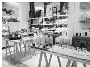
道の駅オリジナル商品や 茶農家こだわりのお茶が並び