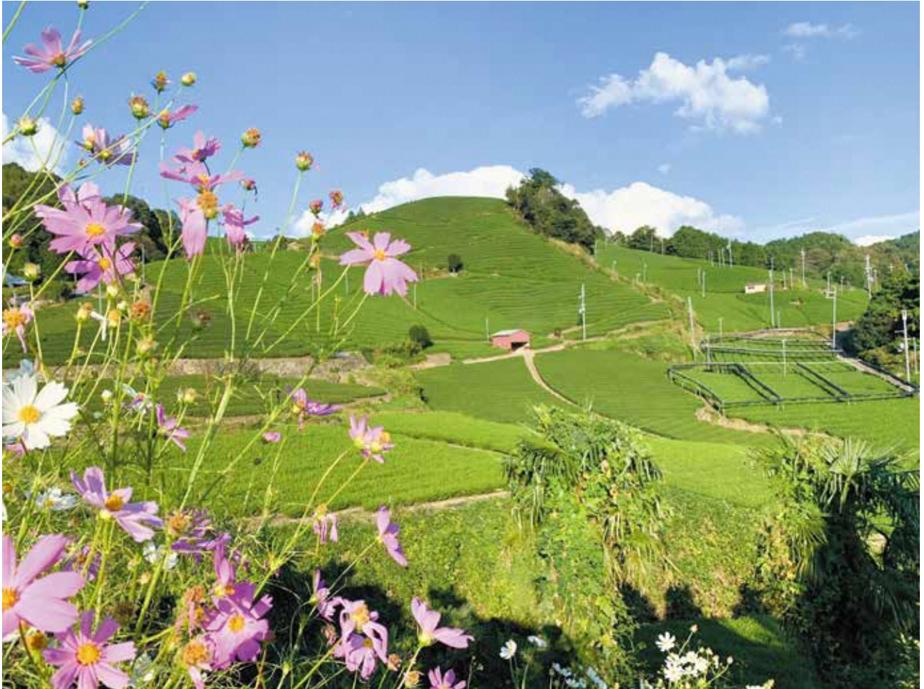
表紙写真：茶畑に映えるコスモス（和束町）