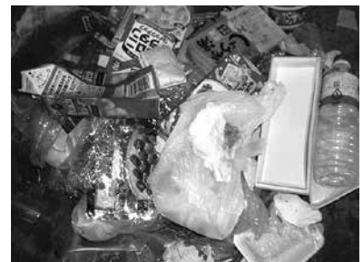
プラスチック容器包装ごみに混ざっていた紙類・ペットボトル類