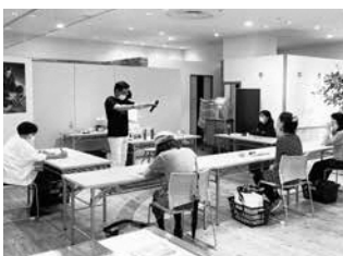
お茶の飲み比べ体験のようす ここでしか聞けない話も楽しい

初めて南山城村を知った方も多く、村に行きたいという声も多く聞かれたそう。新たな村ファンや村のお茶ファンの輪が広がっていくことを期待しています。