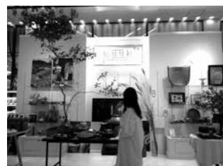
秋の山里を装った ディスプレイが好評