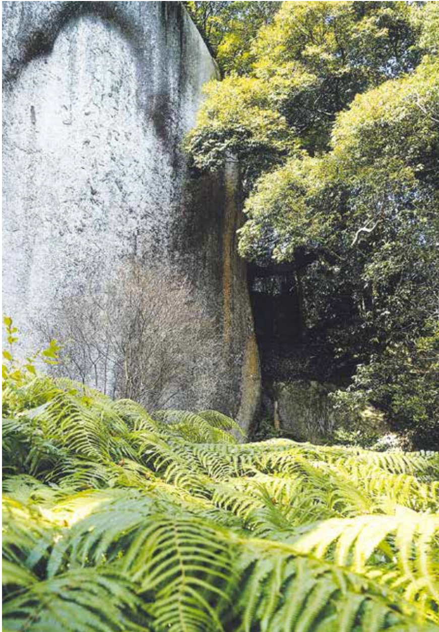
表紙写真：第13回笠置町フォトコンテスト（シダと弥勒摩崖仏 矢延直樹さん）（笠置町）