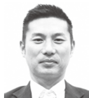
坂本英人 議員 (笠置町)