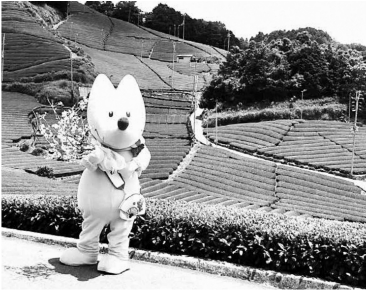
桜の木を手に茶畑の前で撮影するスフラ

6月3日（木）、ワールドマスターズゲームズ2021関西の開会式で使われるフラワーリレー（大会モチーフである桜を開催地域でつなぐセレモニー）の撮影で、大会マスコットのスフラが和束町を訪れました。梅雨の間に出た快晴のもと、美しく映える茶畑を背にスフラが元気よく走りまわりました。今回撮影した映像は、2022年5月13日（金）の大会開会式で使用される予定です。みなさんもぜひワールドマスターズゲームズ2021関西に参加して、開会式の映像とともに大会を楽しんでください。