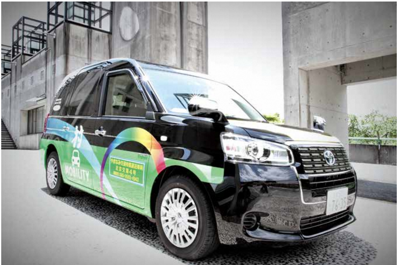
表紙写真：企業版ふるさと納税寄付金を活用してラッピングを施した村タク（南山城村）