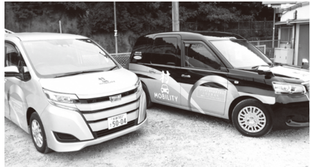
ラッピング施工をした運行車両

運行に使用する車両は、企業版ふるさと納税により寄付を受けた寄付金を活用し、地域のみなさんに認識してもらえらるラッピングを施しました。