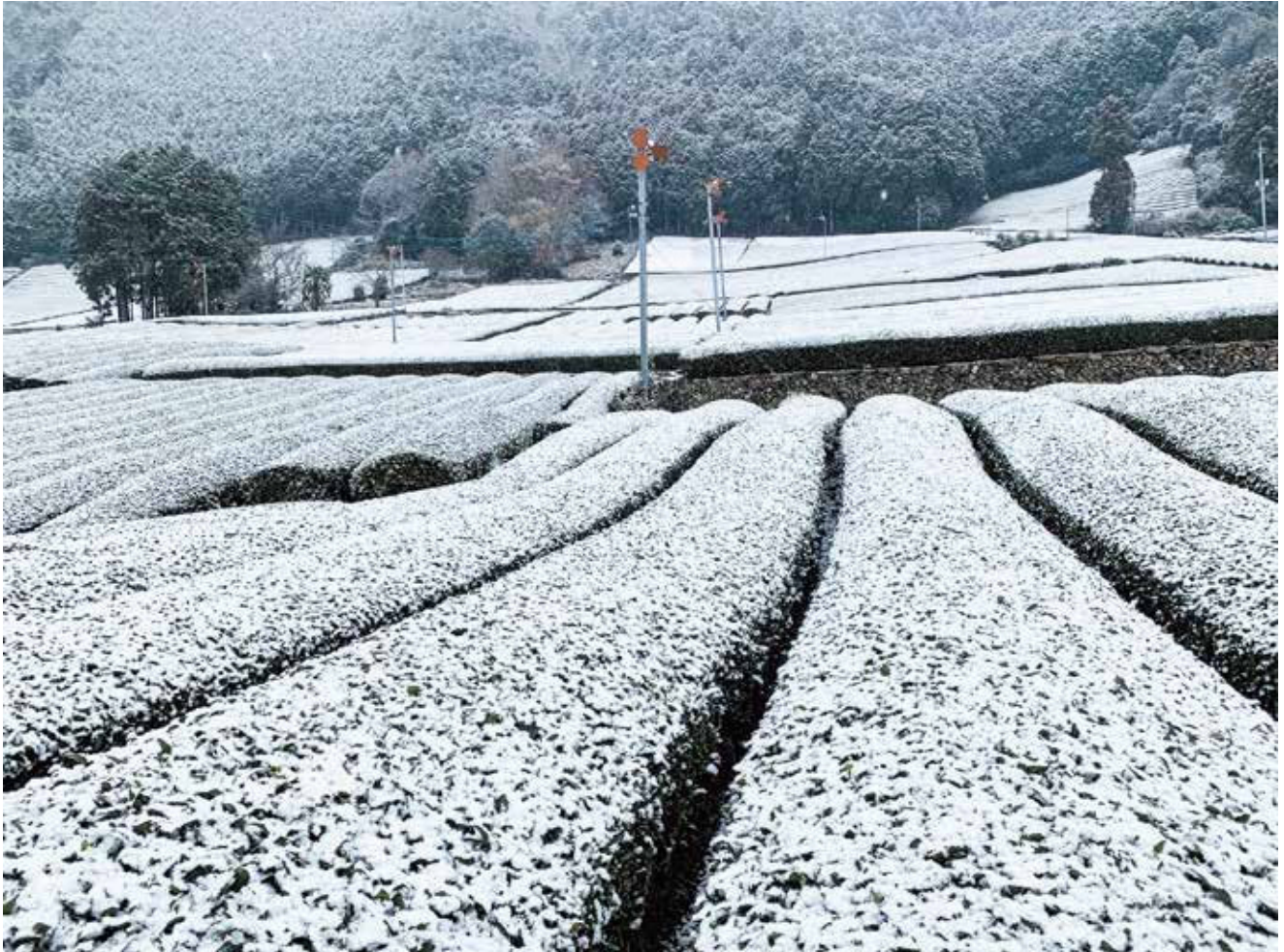
表紙写真：初雪積もる茶畑（和束町原山）