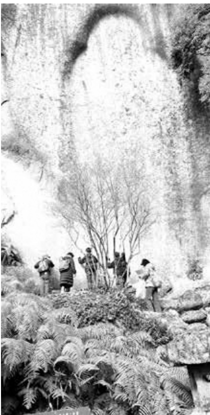
笠置山パワースポットめぐり