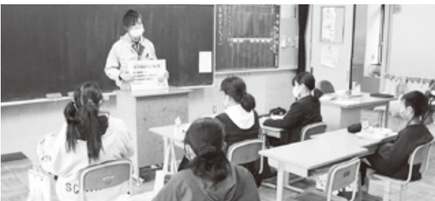
笠置町職員による出前講座の様子

その後、普段馴染みのない防災食を実際に食べてみた児童たちは「いつも食べているご飯よりやらかい」などさまざまな感想を述べ、和気あいあいとしながら給食を楽しみました。