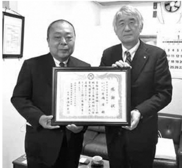
（左から上田専務理事、平沼村長）