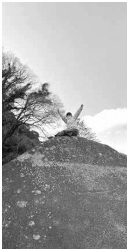
ボルダリング（木津川エリア）