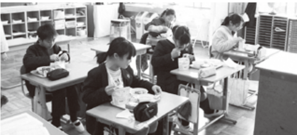
防災食を楽しむ児童たち