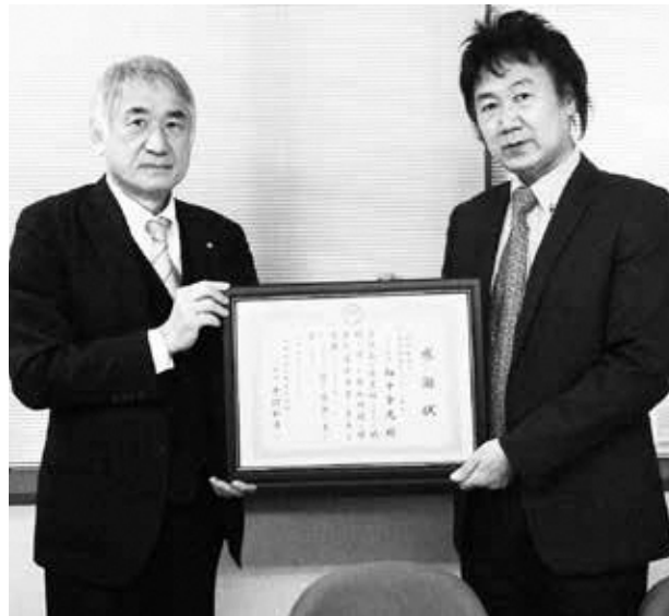
（左から平沼村長、中川専務理事）