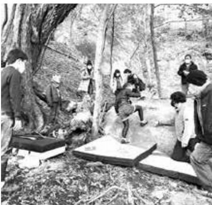
ボルダリング（笠置山エリア）