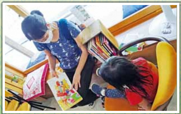
絵本を開いてゆっくり過ごす親子時間