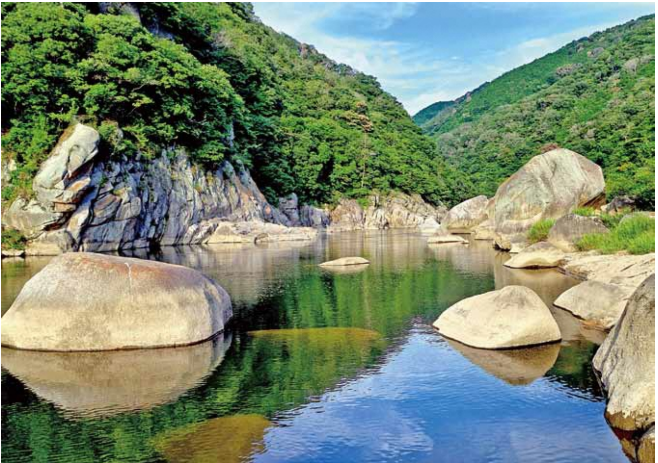
表紙写真：第12回笠置町フォトコンテスト佳作 「清流木津川」