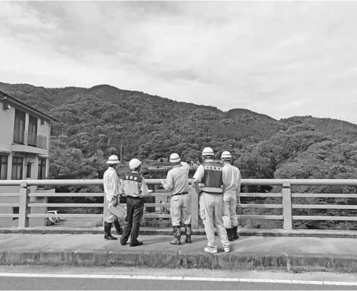
白砂川付近の点検

今後、京都府をはじめ、防災関係機関や町内団体との連携をおこない、防災体制の構築と災害に強いまちづくりを目指します。