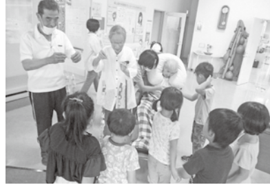
デイサービスみなさんに輪つなぎをプレゼント