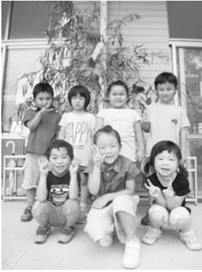
笹飾りの前で記念撮影