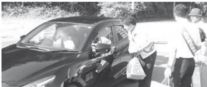
和束町白栖橋交差点付近で街頭啓発