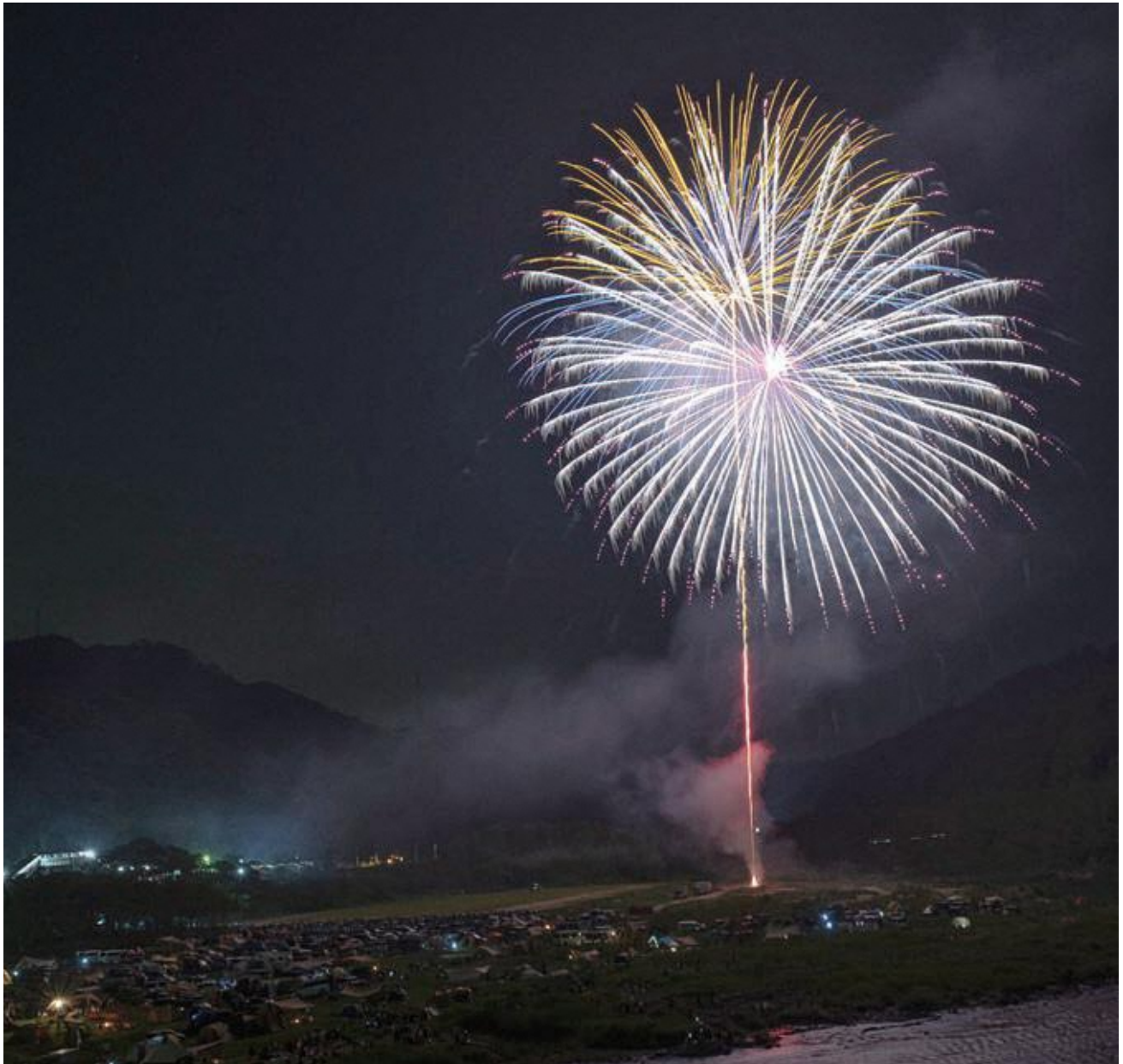
表紙写真：8月3日（土）第31回 笠置夏まつり （※記事等詳細は3ページを参照）