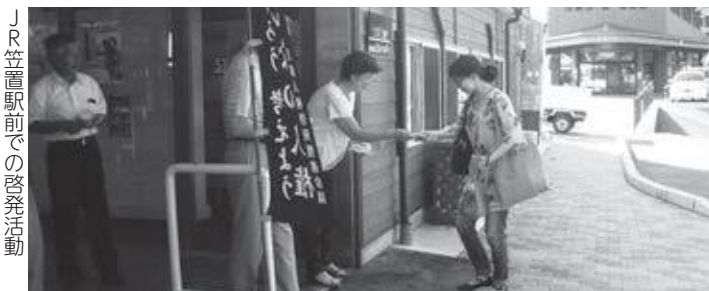
JR笠置駅前での啓発活動

笠置町では8月7日(水)午前7時からJR笠置駅前にて、街頭啓発をおこないました。通勤の方やJR利用の送迎にいられた方などに啓発物品を配りながら、人権の大切さを呼びかけました。