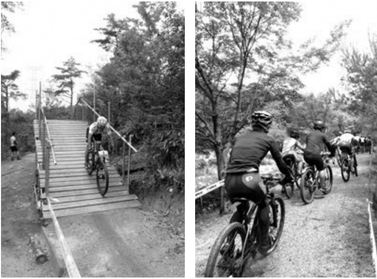
湯船マウンテンバイクランドにて