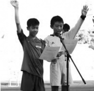
人権サポーター宣言の様子