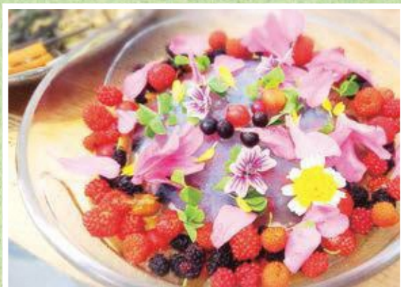
花と野いちごのゼリー

問合せ 移住交流スペース「やまんなか」 （南山城村大字田山小学上フケ10-4） 開館日時：水・金・土曜日 午前10時～午後4時 ☎0743・94・0666