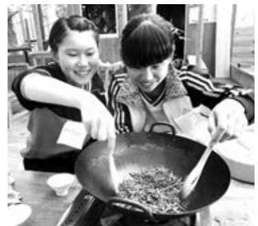
フライパンでほうじ茶づくり