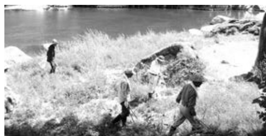
笠置町木津川河川敷

5月26日(日)、木津川漁業協同組合・木津川を美しくする会による「木津川一斉清掃」がおこなわれ、一般の方も多数参加し参加者一同、熱心にゴミ拾いに取り組みました。 見慣れた風景であってもゴミが落ちていたり草が生い茂っていたりするなど、清掃活動を通して木津川の景観に対する意識を新たにすることができました。