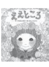
えんじこ エズリン著