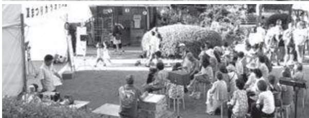
和束夏まつり (昨年の様子)