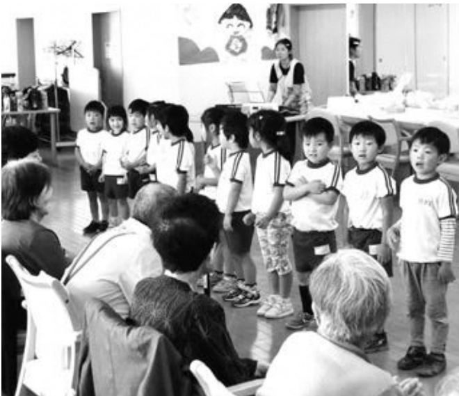
わらくの方々と一緒に歌う子どもたち

その後、風船でバレーボールをしました。子どもたちも大はしゃぎで、わらくの方々も「がんばれ！」と応援したりお互いに楽しい時間を過ごしました。おみやげにバルーンアートをもらい大切に持って帰りました。