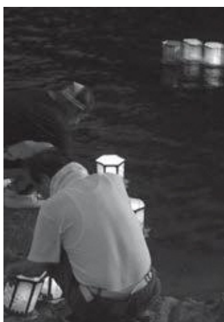
笠置灯ろう流し (昨年の様子)