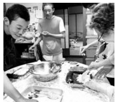
いっしょにお料理を