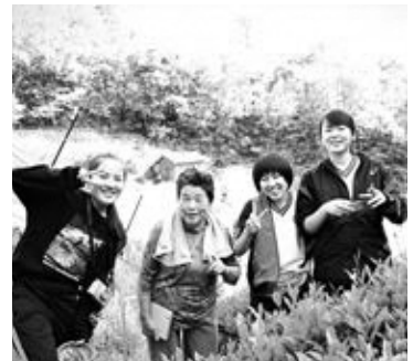
お茶摘みして、晩ご飯のつぐらに