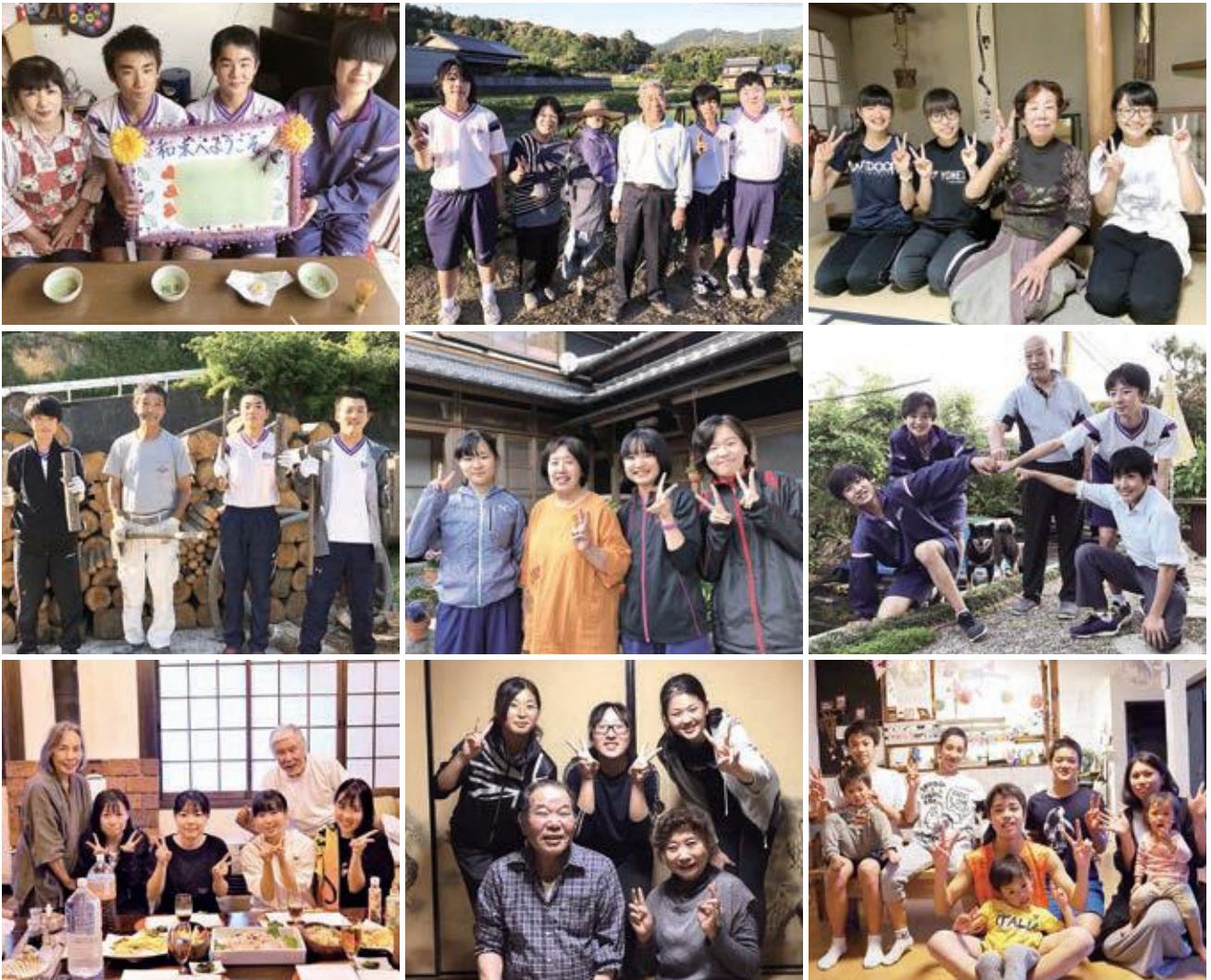
表紙写真：農村宿泊体験受入家庭での様子 (※記事等詳細は5ページを参照)