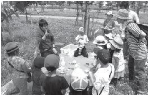
城山台公園でウォークラリー

公園では3町村の児童の交流を目的に、ウォークラリーをおこないました。ミッション指示書にしたがって、5つのチェックポイントで、チームで協力してミッションを遂行しました。各ミッションの合計得点を競い合いながら楽しむことができました。また、お昼はみなでお弁当を食べ、その後はサッカーやドッチビーなどで遊んで楽しく過ごしました。教育委員会生涯学習課では、3町村の子どもたちが積極的に交流できるよう、さまざまな事業を計画しています。ぜひ、親子でご参加ください。