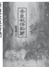
奈良妖怪新聞 木下昌美著