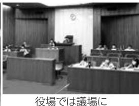
役場では議場に座らせてもらいました

3年生は社会科「わたしたちの住んでいるところ」の学習で、村の道路や建物の様子を調べ、地図記号などを使った「村マップ」作りをするため、6月5日(水)、役場で村の人口や土地利用の様子についてインタビュしました。 いずれの学年も、役場の他にやまなみホール、郵便局、直売所を訪れ、施設の中も見学し仕事内容を説明してもらいました。