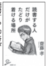
読書する人だけがたどり着ける場所 齋藤 孝著