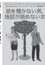
話を聞かない男、地図が読めない女 アンソニー・バーバード著