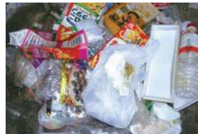
プラスチック容器包装ごみに混ざっていた紙類・ペットボトル類