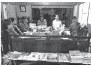
ブックカフェの様子

また、参加者の本の紹介では「そんな本あるんや〜!」といった盛り上がりなどもあり、好奇心がくすぐられる楽しい時間となりました。