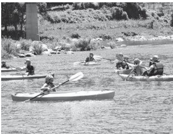
人気のカヌー体験 (過去のイベントの様子)