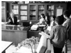
村長にもたくさん質問しました

探検の後には、発見したことや教えてもらったことをもとに「大河原クイズ」を考えました。