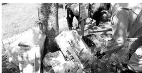
南山城村やまなみホール下河川敷から出たゴミ

5月26日(日)、木津川漁業協同組合・木津川を美しくする会による「木津川一斉清掃」がおこなわれ、一般の方も多数参加し参加者一同、熱心にゴミ拾いに取り組みました。 見慣れた風景であってもゴミが落ちていたり草が生い茂っていたりするなど、清掃活動を通して木津川の景観に対する意識を新たにすることができました。