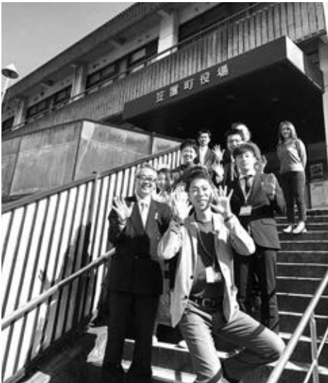
就任当日、総務財政課メンバーでとった思い出の写真です