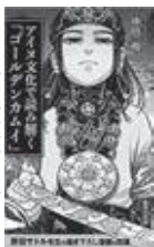
アイヌ文化で読み解くヨールデン・カムイ 中川 裕著