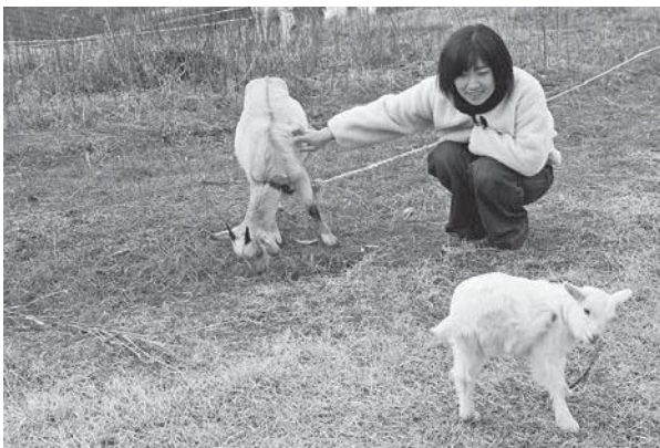
南山城村自然の家のヤギランド

これからも、南山城村自然の家を拠点に、自然豊かな南山城村の魅力を発信・発信をしていきたいと思っています。また、インバウンド対応や外国人向けに情報発信もしていきたいと考えています。みなさん、どうぞよろしく願いいたします。