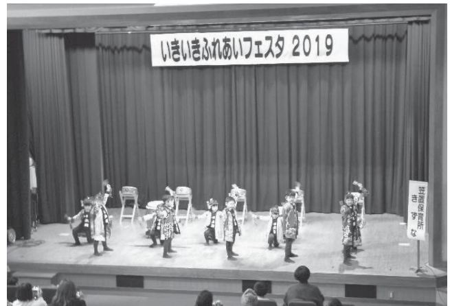
笠置保育所 舞台「なるこ」

今年度も「笠置さわやか会」と共同開催したところ参加者は約150人にのぼり、大盛況の1日となりました。