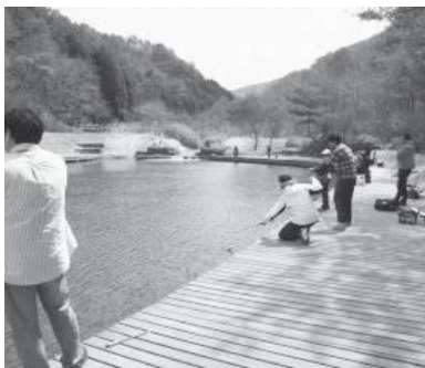
湯船森林公園フィッシングエリア

既にあちらこちらで盛り上がりを見せている森林公園ではありませんが、まだまだできること、しなければならぬことはたくさんあります。特にワールドマスタースゲームズの開催期間中は、世界中からたくさんの方に来ていただくことになりました。このような世界規模の大会に関われることは私個人としても大きな挑戦になりますし、湯船で開催されて良かったなと会場に訪れた全ての方に思っていただけのようにしていきたいと思っています。