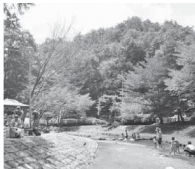
湯船森林公園バーベキューエリア