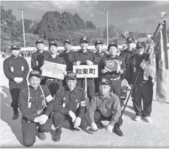
奨励賞受賞の和束町消防団

大会に出場された消防団員さんについては日々練習を重ね、南山城村消防団は優勝を飾り、笠置町消防団は8位、和束町消防団は奨励賞を受賞という結果となりました。