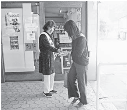
JR 笠置駅前での啓発活動

南山城村では、8月3日（金）にやまなみホールで人権教育研修会を開きました。「人権・同和問題の解決をめざして」をテーマに講師をお招きし講演・啓発をおこないました。