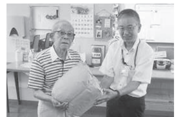
利用者の方に直接お茶を手渡しました(加茂の里)