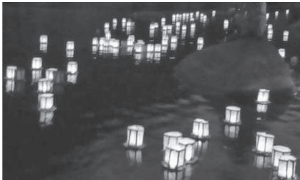
灯ろう流しの様子

ゆかたまつりは、いこいの館ゲートボール場内で出店やカラオケ大会、また「笠置音頭」を皆で踊り、大変盛り上がりしました。