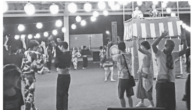
ゆかた祭りの様子