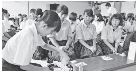
お茶を振る舞う和束中学校の生徒たち

今回のサミットを通して、茶農家のみなさんには改めて農家としてのこれからの考える機会になり、中学生については郷土愛を育むとともに、お茶の郷「茶源郷 和束」の魅力を伝える貴重な機会になりました。