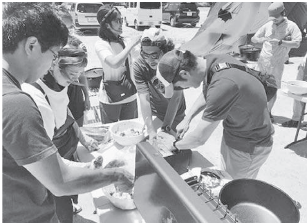
みんなで協力して昼食作り

SUP演習は川遊びの新たな提案として、木津川にボードを浮かべて、基本的な乗り方や数人で力をあわせてのレクリエーション等も交えて、楽しくおこないました。