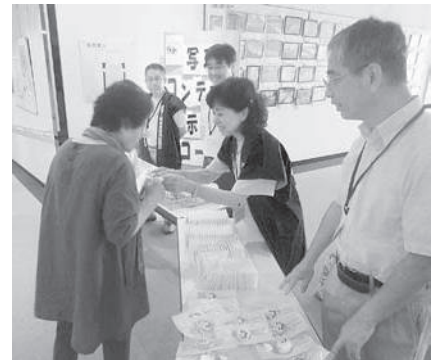
南山城村（人権教育研修会）での啓発