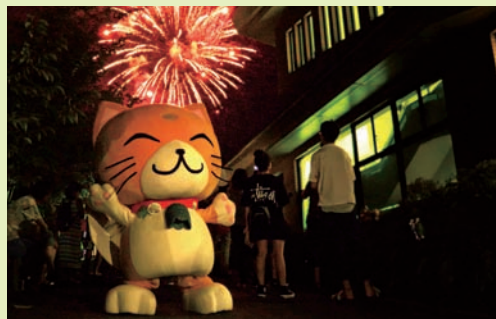
笠やんと花火

夏まつりには、笠やんも登場し、子どもたちは大喜びで笠やんにさわったり、記念写真を撮ってもらっていました。来年の開催がすでに待ち遠しい30回記念にふさわしい夏まつりでした。