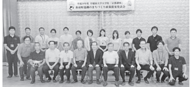
政策提案発表後の記念撮影

A班は「茶源郷伝道師プロジェクト」と題して町民や和束ファンによる町の魅力発信、B班は「私が株式会社湯船の社長だったら」と題して湯船森林公園をドローン訓練場として活用する案などを提案されました。