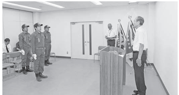
優勝報告会で全国大会に向けた決意を表明されました

チームは、10月19日（金）に富山県広域消防防災センターでおこなわれる第26回全国消防操法大会に京都府代表として出場されます。