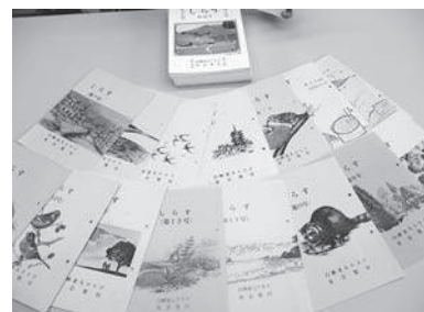
これまでに発刊された全40号

最後に、地域のみなさんのお考えや想いは多種多様で、その時々出来事が文章に託されて後々になって振り返り「しらす」を読んだ時に懐かしく思えて走馬灯のごとくよみがえりしのがことができ、大変に意味深いものと思えます。また、今後もなお一層この和東町のローカル性豊かな特色を活かして人々の想いが後世に受け継がれますことを祈念します。