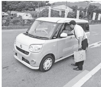
和束町白栖橋交差点付近で街頭啓発