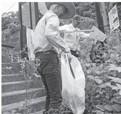
笠置町木津川河川敷

今後も木津川の景観を守り次世代に残していくため木津川を美しくする活動に取り組んでいきます。