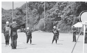
優勝した第1部の競技の様子