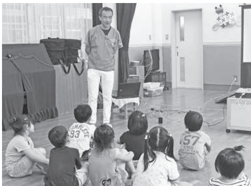
歯科医の先生の話きく子どもたち

子どもたちだけではなく、むし歯予防のためには「大人もフッ化物入り歯磨き剤を使うことがおすすめ」とのことでした。