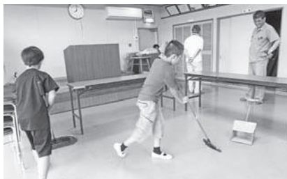
今山公民館での清掃

振り返りの場面では、「地域の人に喜んでほしい」、「自分の地区以外の公民館に行けたのがよかった」、「すごくきれいに使われているのでびっくりした」といった感想を交わしていました。