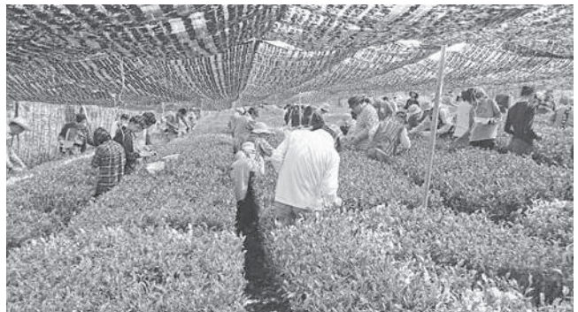
摘み手のみなさんのご協力が出品茶を支えています