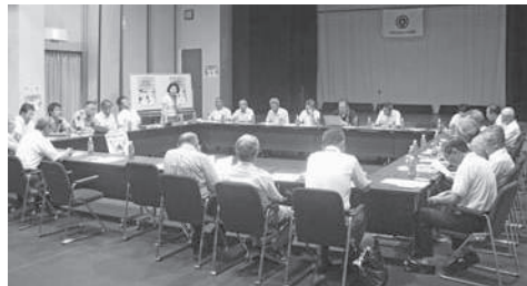
笠置町推進委員会の様子

啓発活動には和東町社会を明るくする運動連絡協議会を構成する各種団体の代表ら20人余りの方が