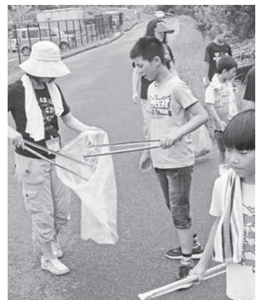
南山城小学校周辺道路のごみ拾い