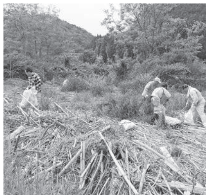
南山城村やまなみホール下河川敷