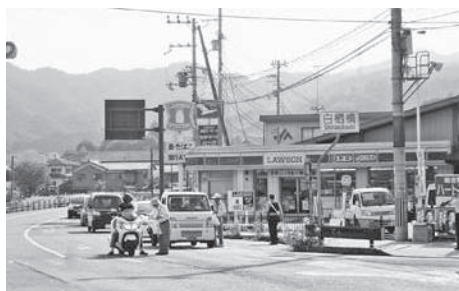
和東町白栖橋前交差点で街頭啓発

が通勤・通学途中のドライバークラスや学生らに啓発パンフレットや啓発物品を配りながら、運動への協力を求めています。また2日(月)に保育園・小学校を、3日(火)に中学校を訪問し、児童・生徒に一言ずつメッセージを伝えました。