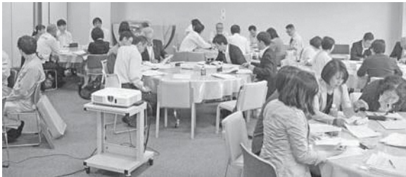
部会別協議の様子