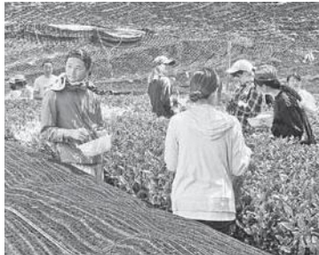
お茶摘み体験の様子

当日は、お茶摘み体験や新茶の試飲、茶葉のてんぷらの振る舞いなどがおこなわれ、メインイベントのコンサートでは青々とした茶畑に響く清々しく涼やかなフルート三重奏の音色に、参加者は「ほのぼのとしたひととき」を堪能しました。