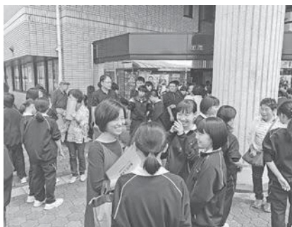
離村式で最後のお別れ