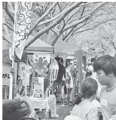
特産品販売等模擬店(昨年の様子)