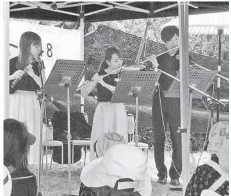
ゆったりとした時間が会場を優しく包み込みました