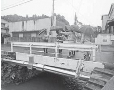
南山城村・田山地区