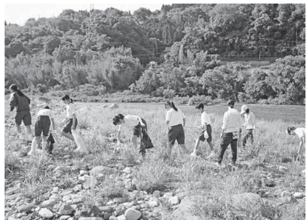
笠置大橋下流の河原での清掃活動の様子

当日は天気もよく強い日差しの中での作業となりましたが、生徒は自分たちの住む地域をよりよくするために、一生懸命汗を流しました。