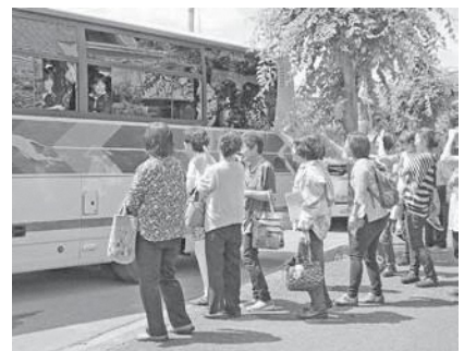
バスを見送る受入家庭のみなさん