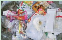
プラスチック容器包装ごみに混ざっていた紙類・ペットボトル類