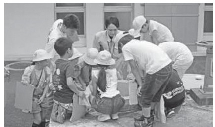
月ヶ瀬浄水場にて