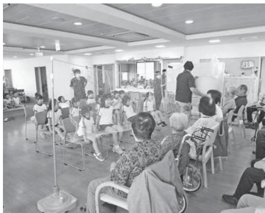
高齢者と大玉風船バレーを楽しむ子どもたち

その後高齢者のみなさんに肩たたきをし、バルーンアートのおみやげをいただき、園に戻ってから「またいきたいね。」と笑顔で話すなど、とても楽しいひと時を過ごせました。