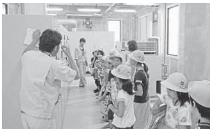
和東町中央浄水場にて

児童たちはこの日の水道施設の見学を通して、浄水場が生活に欠かせない水道水をつくる重要な施設であることと、資源である水の大切さを実感しているようでした。