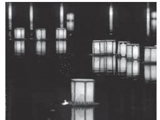
笠置灯ろう流し(昨年の様子)