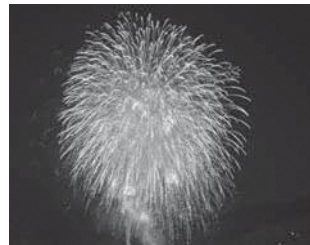
笠置夏まつり(昨年の様子)