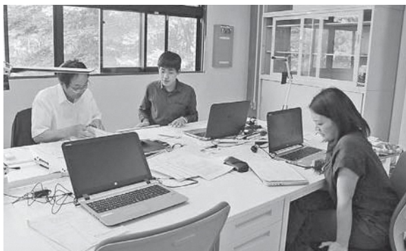
雇用創造協議会事務局の様子

4月27日(金)に雇用創造協議会が発足しました。笠置町は山や川におけるアウトドア体験に加え、インバウンドの誘致等、今後、宿泊客数の増加の可能性を秘めています。人口減少・高齢化による担い手不足や特産品がないことが課題となっています。こうした課題に対応するため当協議会は、事業主に対するアウトドアを活かした企画立案、地域求職者に対する観光ガイド養成研修などをおこなうとともに観光商品開発や特産品開発をおこない雇用機会の拡大を目指します。今後セミナーなどを開く予定ですので奮ってご参加ください。活動拠点となる事務所は、笠置いこいの館2階となりますのでぜひお問合せください。