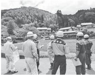
笠置町・草田切(西奥)

出水期、台風シーズンを迎えるにあたり、町村内で災害の発生が予想される危険箇所の点検や現状を確認し、防災対策の検討や関係機関との防災体制の確立を図ることを目的として、京都府関係機関・警察・消防などの防災関係機関と共に河川や土砂災害について危険とされる箇所の現地確認をおこないました。 今後、京都府をはじめ、防災関係機関との連携を密にしながら、防災体制の更なる構築と災害に強いまちづくりを目指します。