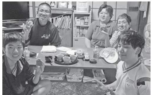
受入家庭で団らんの様子