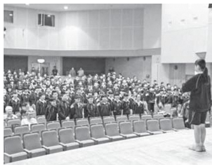
離村式（あじさいホール）で生徒たちから合唱のお礼