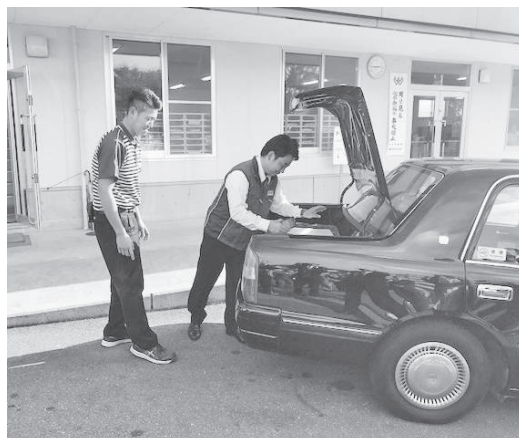
タクシーに荷物を詰め込む様子