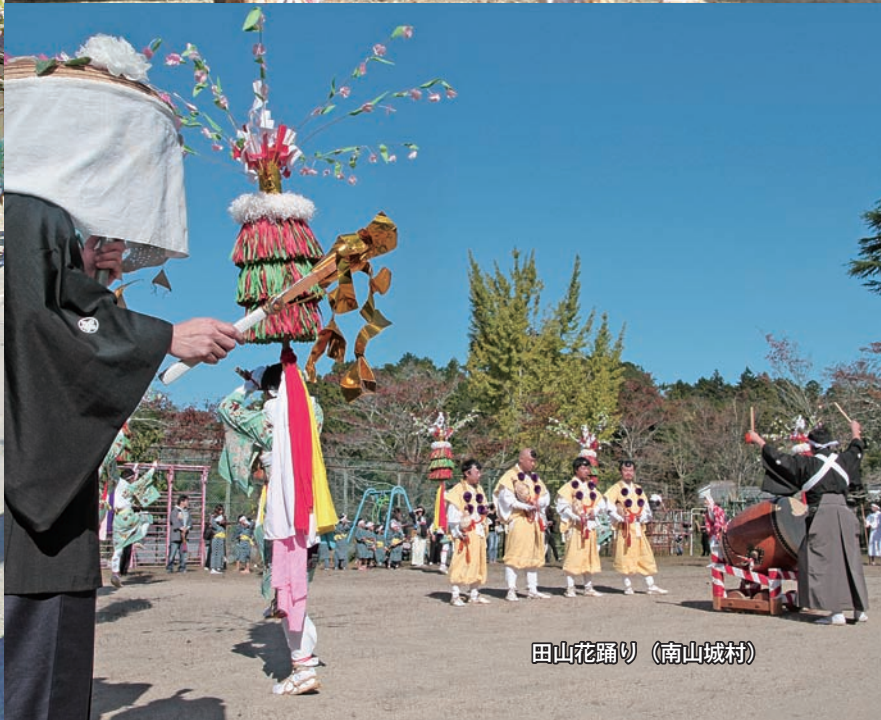
田山花踊り (南山城村)