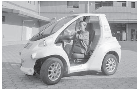
コムスに乗っている様子

問合せ・予約・受渡場所 天然温泉わかさぎ温泉 笠置いこいの館 ☎ 0743・95・2892 (代表) ☎ 0743・95・2821 休業日 第一と第三水曜日と年末年始