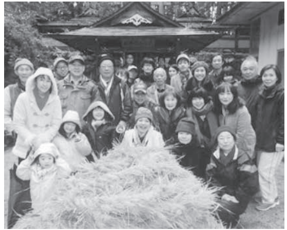
あまてらすみかどじんじや 天照御門神社で勧請縄づくり