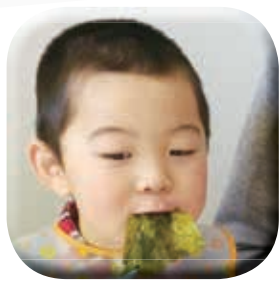
にしだ まひろ 西田 真優くん

南山城村 南大河原 平成 25 年 5 月 27 日生 仮面ライダーの様に弱い 人を守れる大人に!!