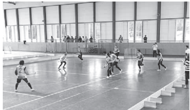
インドアホッケー大会の様子