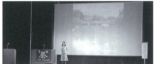
昨年の様子(第38回大会)