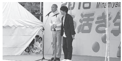
コロコロチキチキペッパーズによるステージ