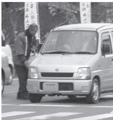
白栖橋交差点での街頭啓発(和束町)