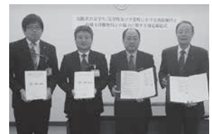
山城木津郵便局・村内郵便局