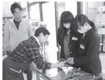
和東茶カフェで店員さんと一緒にお茶を入れています

今回の体験が、生徒たちの将来の選択肢を広げることに繋がってくれることを願っています。