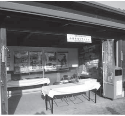
鍋フェスタにおける啓発事業