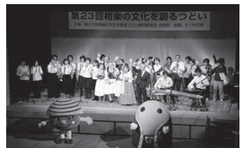
【第2部】舞台発表 出演団体(出演順)