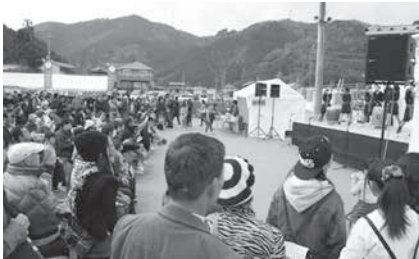
ステージイベント (笠置小学校・太鼓)

12月4日(日)、わかさぎ温泉笠置いこいの館で、第7回全国ご当地鍋フェスタ「鍋ー1グランプリ」を開きました。ご当地鍋は10府県21団体、ご当地グルメは7府県18団体が出店し、ステージイベントや、キッズイベントのボルダリングなどもおこない、約1万1千人の来場者にお越しいただきました。グランプリは笠置町出店「笠置創造・デザイン会議」の『北海道×笠置町 笠置道トマトポトフ』、準グランプリは奈良市出店「奈良かっぱ鍋普及会」の『かっぱ鍋』、敢闘賞は伊賀市出店「名阪上野忍者ドライブイン」の『伊賀牛牛汁』でした。たくさんのご来場ありがとうございました。