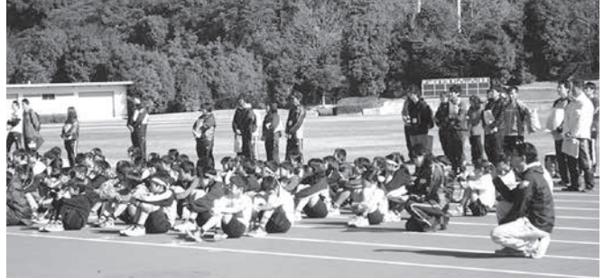
代表に選ばれた和東小学校の選手たち