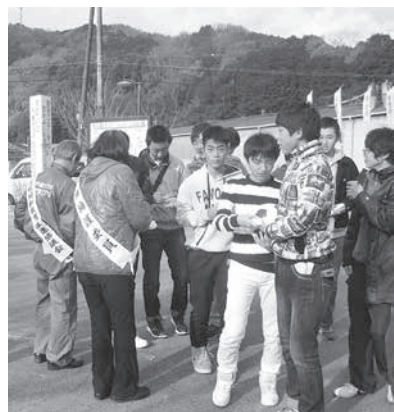
鍋フェスタでの街頭啓発(笠置町)