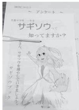
当日配布したサギソウブック

最初は緊張していましたが、徐々に会場の雰囲気にも慣れ、来場者からの質問にもしっかり受け答えしていました。100部準備していた「サギソウの育て方ブック」「サギソウバッジ」は全てなくなり、たくさんの来場者にサギソウについて考えてもらうよい機会となりました。