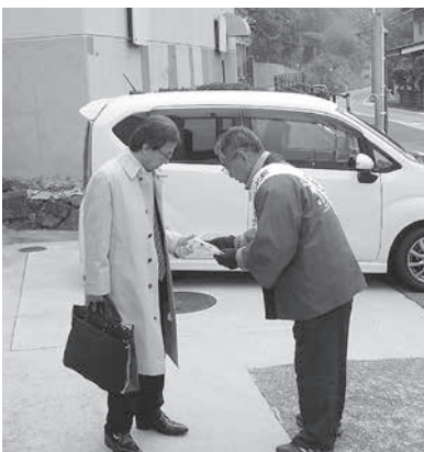
JR大河原駅での街頭啓発(南山城村)

笠置町税住民課 ☎0743・95・2301 (代表) 和束町人権啓発課 ☎0774・78・3488 南山城村総務課 ☎0743・93・0102 (直通)