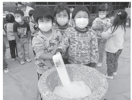
和束保育園でお餅つき