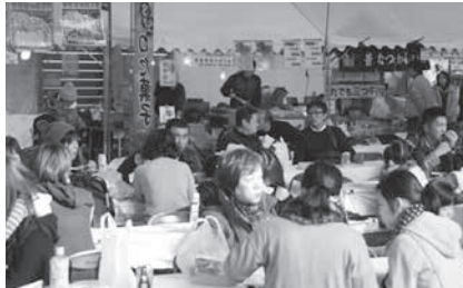
グルメブースの様子