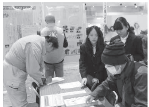
京都府総合見本市会館(京都パルスプラザ)での様子