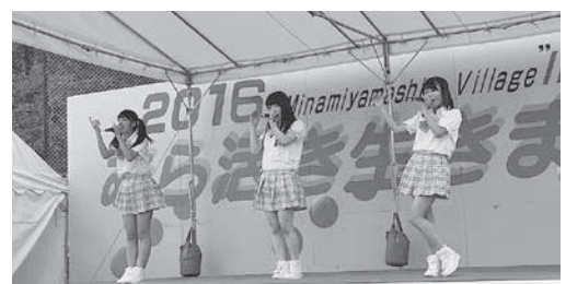
マリーナブルーによるアイドルショー

また、特産の「お茶」の手もみの実演や、肉厚で美味しい原木栽培しいたけを使った焼きしいたけ、自然豊かな村で育った野菜を味わえる産品鍋、つくたての餅、各種手作りのブースなど、このまつりに来場してこそ堪能できる産品が目白押しでした。村内外を問わず、来場者と会場のスタッフもみんな南山城村の秋を目いっぱい味わえたのではないのでしょうか。