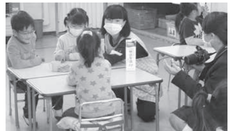
役場での広報活動と保育士体験の様子です