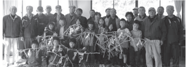
できあがったしめ縄に満足の児童たち