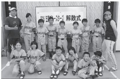
笠置ブルースターズ

8月6日（土）、和束運動公園において第47回相楽小学生ソフトボール大会が開かれました。管内3町村からもそれぞれ1チームが出場し、夏休みの早朝や猛暑の中、一生懸命練習に励んできた成果を存分に発揮しました。大会には全7チームがエントリーし、AゾーンとBゾーンに分かれて、トーナメント戦とリーグ戦をおこないました。管内のチームでは、Aゾーンで南山城オールスターズ（南山城小）が、Bゾーンで和束ファイターズ（和束小）がそれぞれ準優勝に輝きました。