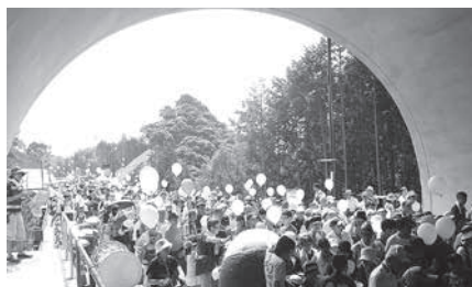
たくさんの来場がありました。

一般国道163号北大河原バイパスの開通を前の8月14日（日）にバイパスのトンネルウォーキングイベントを開きました。