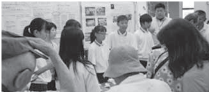
1年生 サギソウの学習掲示の様子

笠置中学校では、地域の自然や文化について学び・考える「ふるさと学習」を通じて、これからも地域の魅力を伝えるとともに、その振興に取り組んでいきます。