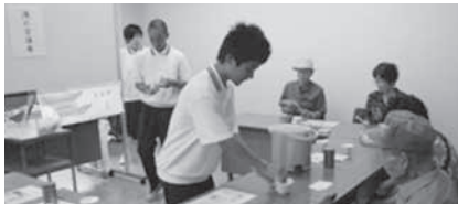
2年生 お茶の淹れ方講座の様子