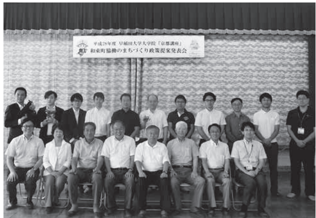
政策提案発表会で集合写真（和束町社会福祉センター）

早稲田大学大学院のみなさん、住民のみなさんにおかれましては6日間ありがとうございました！