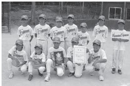
和束ファイターズ