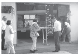
「知ろう・守ろう・考えよう」街頭啓発の様子（JR笠置駅前）

南山城村では、8月2日（火）にやまなみホールで人権教育研修会を開きました。「介護と人権」をテーマに講師をお招きし講演・DVD上映・啓発をおこないました。