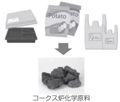
コークス炉化学原料