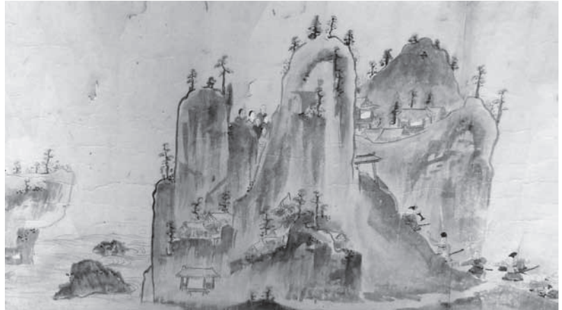
笠置寺縁起の一場面

この縁起には、寺の創建から南北朝の動乱までの歴史が記されており、南山城の縁起としては中世に遡る数少ない例だと言われています。史料の多くが失われた当寺において本作が伝わってきた意義は大きく、また太平記を描く早期の作例としても注目されています。