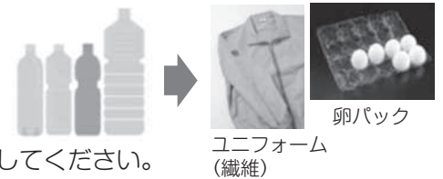
ユニフォーム (繊維)