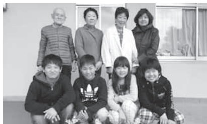
シニアライフサポートのみなさんと記念撮影(和束町)