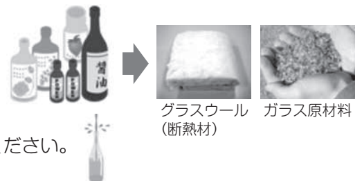
グラスウール (断熱材)