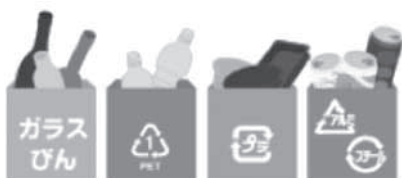
イラスト出典 (日本容器包装リサイクル協会)

ごみの分別収集にご協力ください。 ※収集日については、各町村のごみカレンダーでご確認ください。