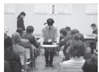
茶香服大会の様子