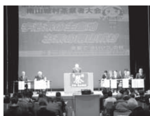
茶業者大会の様子