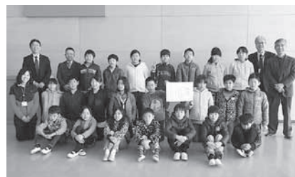
みんなでスイセンを育てました(南山城村)