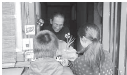
スイセンの花をプレゼントする児童(笠置町)