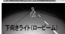
下向きライト(ロービーム)