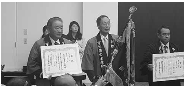
産地賞（6 回目）の受賞