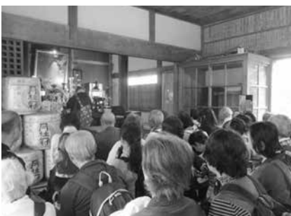
11月13日 御祈禱の様子