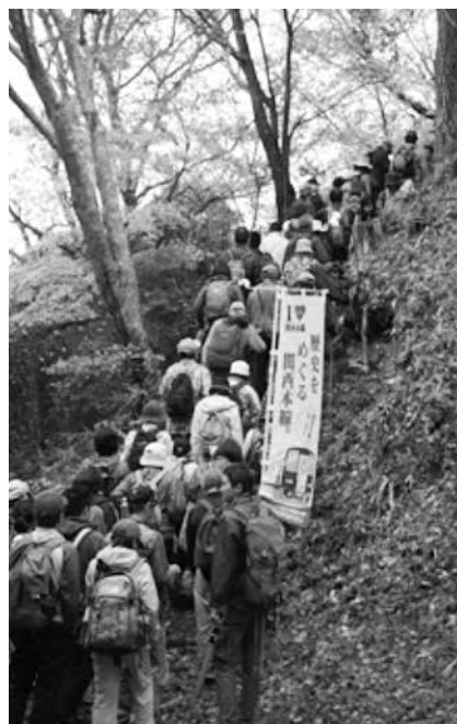
11月20日 ハイキングの様子