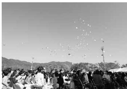
開会式で風船飛ばし

今年も世界のお茶を楽しむエリア 33 ブース、お茶の体験エリア 31 ブース、フリーブースエリア 37 ブース、お茶と森の体験エリアは 21 ブース、その他に茶席エリア、茶畑ツアー、アートエリアなどに加え、今年度から新しく追加されたMTB体験エリアなど、おおいに盛り上がりを見せました。