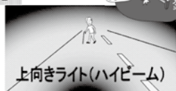
上向きライト(ハイビーム)

日が暮れるのが早くなりました。歩行者は、明るい場所を選んで歩いたり、反射材をつけ、ドライバーからいち早く発見してもらいましょう。自転車や車は、早めのライト点灯をしましょう。対向車や前方に車両がない場合は上向きライトにするなど、こまめなライトの切り替えでいち早く危険を発見しましょう。