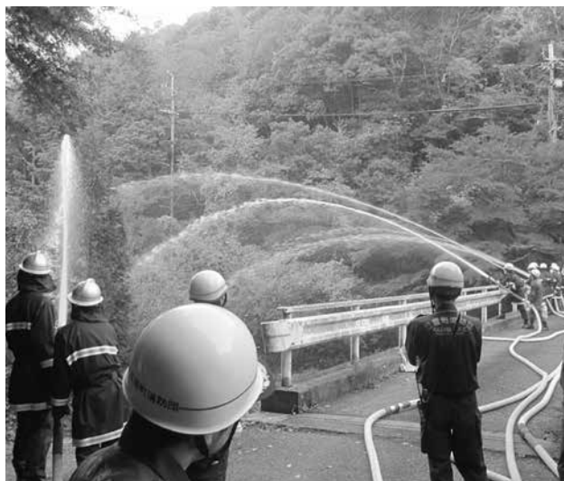
飛鳥路区布目橋からの放水の様子