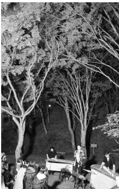
11月5日 箏の演奏の様子

11月20日（日）午前10時から「笠置もみじまつり」が開かれ、もみじ公園内では、笠置町商工会等による豚汁やぜんざい等の出店の他、Kea Kapua（フラダンス）や森の音楽倶楽部（ベンチャーズバンド）、やまなみシルバーコーラスの催しにより盛り上がりが見られました。また当日は「もみじを通して五感を愉しむハイキング～京都・笠置山を巡る～」が開かれ、休憩の際に立ち寄ったもみじ公園内では参加者100人、綺麗に色づいたもみじを楽しむことができました。