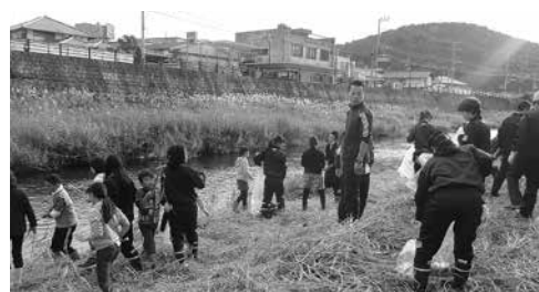
和束川で清掃活動

株式会社大北リサイクルのみなさんの指導の下、和束中学校の生徒が和束小学校の児童に声をかけ、みんなで協力して清掃に取り組みました。