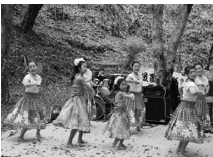
11月20日 もみじまつり(Kea Kapua)