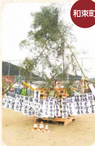
和束町児童公園での様子