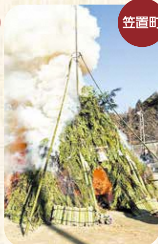
西部ふれあい広場での様子