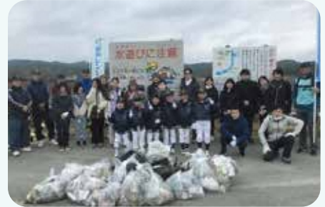
第5回の活動の様子