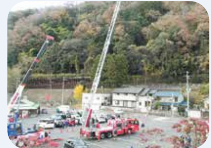
はしご車や災害救助車両の展示

地震はいつ発生するかわかりません。災害には日ごろの備えが大事となりますので、各ご家庭では避難場所への経路の確認や、3日程度の食糧等の備えをおこない、自助で取り組めるものは取り組んでいただきますようお願いいたします。