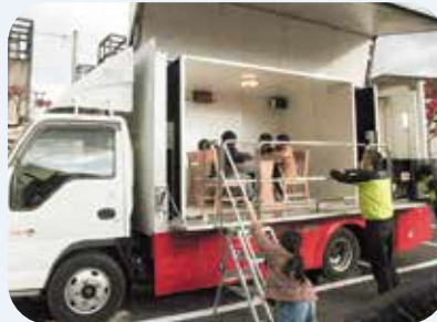
起震車体験の様子

さて、新年を迎えた1月1日の午後1時に能登半島を震源とする大規模な地震が発生しました。被災されました皆さまには心よりお見舞い申し上げます。1日も早い復旧、復興がなされますようお祈り申し上げます。