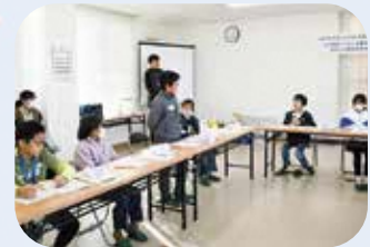
感想を発表する様子