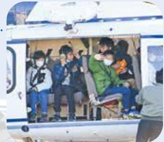
ワクワク、ドキドキした様子で離陸を待つ子どもたち

この日は定住自立圏内の小学生4・5・6年生19人が参加し、府県をまたいだ交流を深め、圏域住民としての一体感をより一層強めた1日となりました。