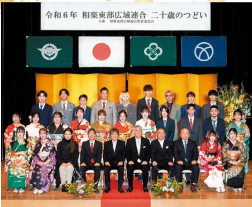
和束中学校区の参加者 (和束町)

1月8日(月) 祝、成人の日に相楽東部広域連合教育委員会主催による「令和6年二十歳のつどい」がおこなわれ、笠置町・和束町・南山城村で合わせて37人の二十歳となる参加者が集いました。会場となった南山城文化会館(やまなみホール)では、スーツや振袖などの華やかな晴れ着をまとった参加者が門出を祝い、来賓や恩師に見守られながら式典が執り行われました。