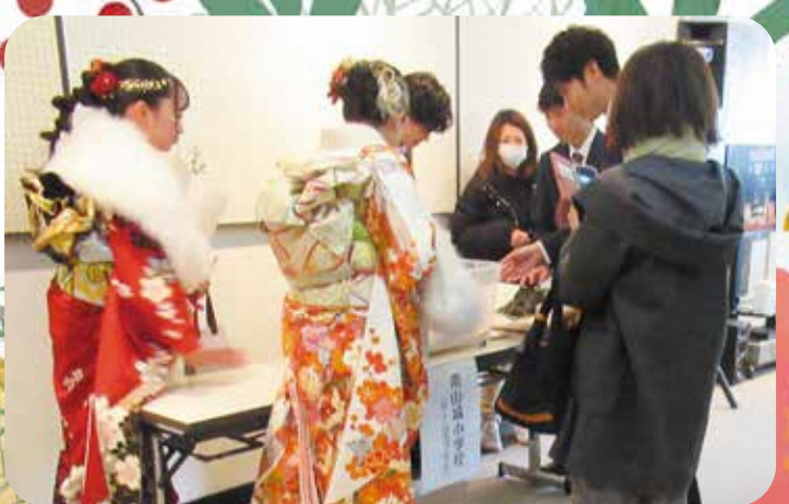
タイムカプセル開封の様子