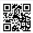
京都マラソン公式HP

問 京都市市民スポーツ振興室 ☎075・222・3138 FAX075・213・3367