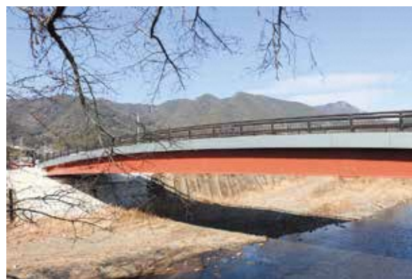
新しくなった祝橋

HP https://www.union.sourakutoubu.lg.jp (和束町史編さん室)