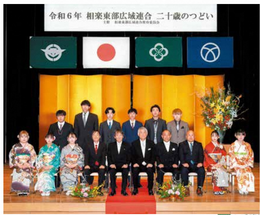
笠置中学校区の参加者 (笠置町・南山城村)

今後、二十歳となられたみなさんが、それぞれの場所で活躍されることを心より祈念します。