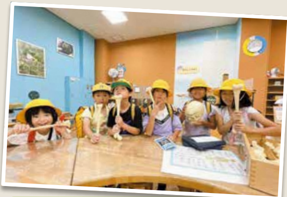
3年生 琵琶湖博物館