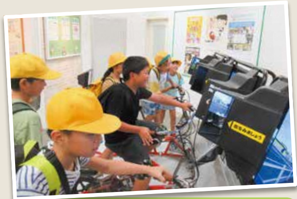
4年生 国際マンガミュージアム・京都府警察広報センター