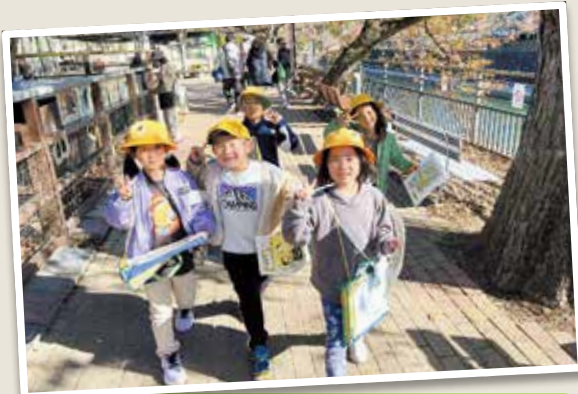
1年生 京都市動物園

普段学校ではできない貴重な体験や知識を楽しみながら学び、3小学校の友達と交流することで、子どもたちの大きな成長につながりました。