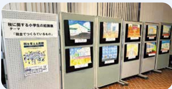
和束町 和束町役場住民ホールにて

「税を考える週間」の一環として、11月11日(土)～17日(金)に「税金でつくられているもの」をテーマに和束町・南山城村の小学校の児童たちが思い思いに描いた絵画作品を展示しました。