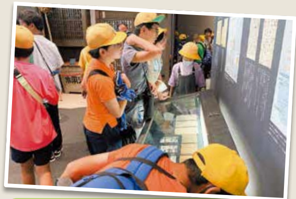
6年生 ピース大阪・大阪市内散策