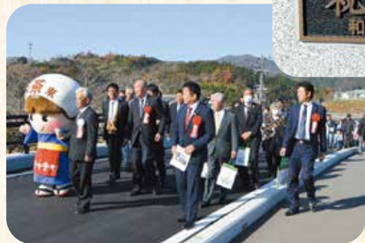
渡り初めのようす

祝橋の開通式がおこなわれました 12月10日(日)、町道鷲峰山線祝橋の開通式がおこなわれました。