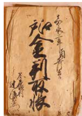
嘉永2年(1849)江戸金判取帳 江戸とのお茶取引を示す帳簿

HP https://www.union.sourakutoubu.lg.jp (和東町史編さん室)