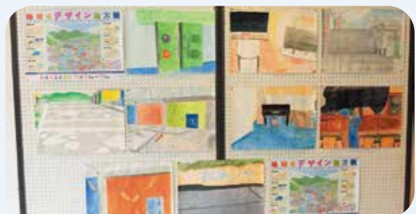
南山城村 南山城村文化会館(やまなみホール)にて