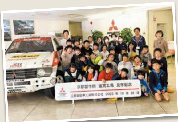
5年生 三菱自動車(京都製作所 滋賀工場)