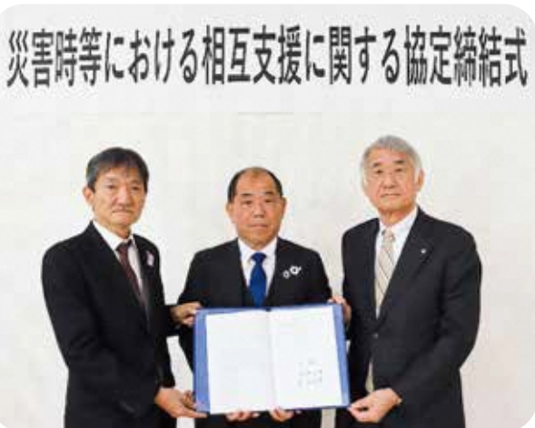
左：中笠置町長 中：馬場和束町長 右：平沼南山城村長

本協定は、災害時に限らず感染症等の場面でもその効力を発揮する内容のものとなっており、相楽東部3町村の更なる連携強化が期待されます。