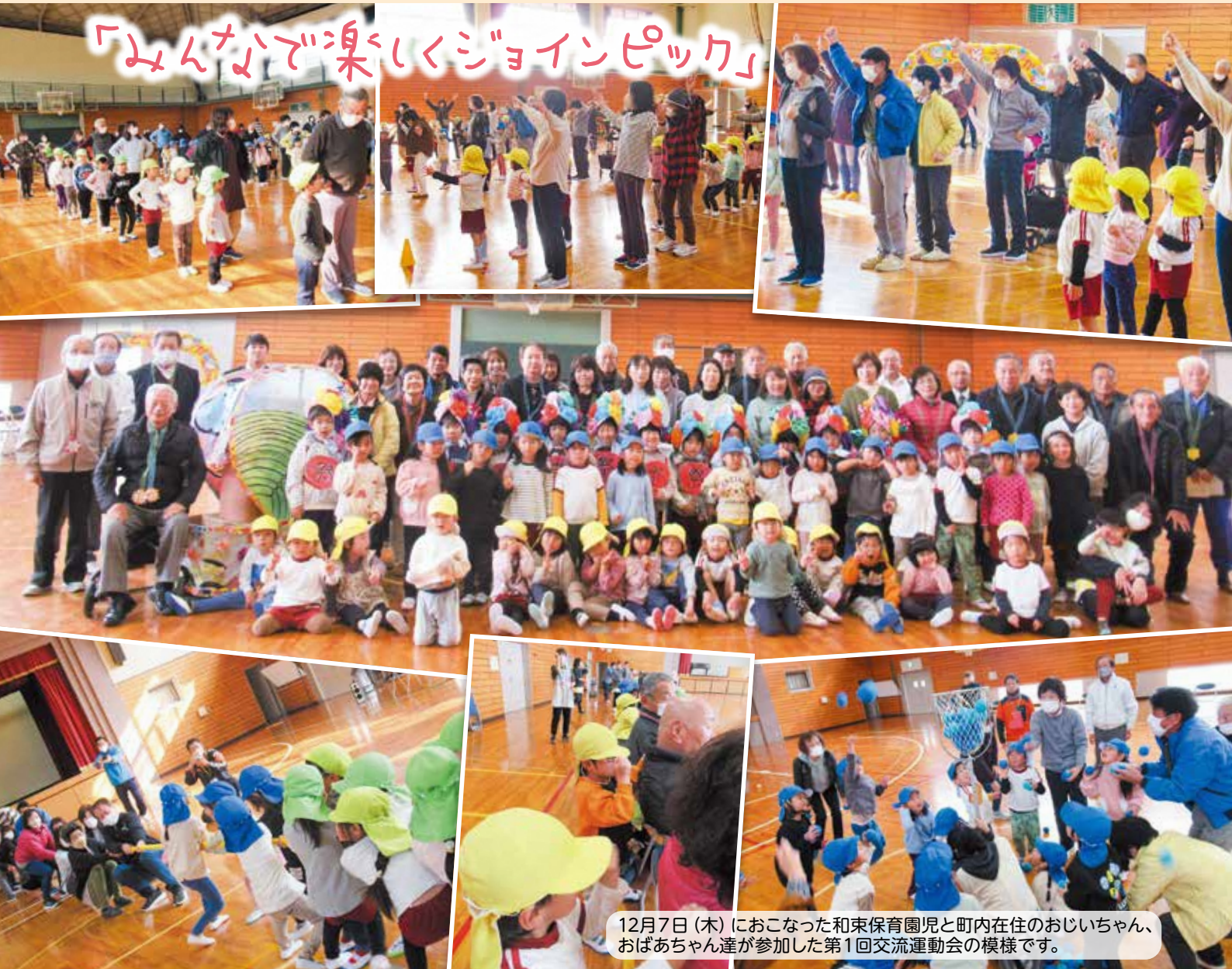
「みんなが楽しくジョインピック」