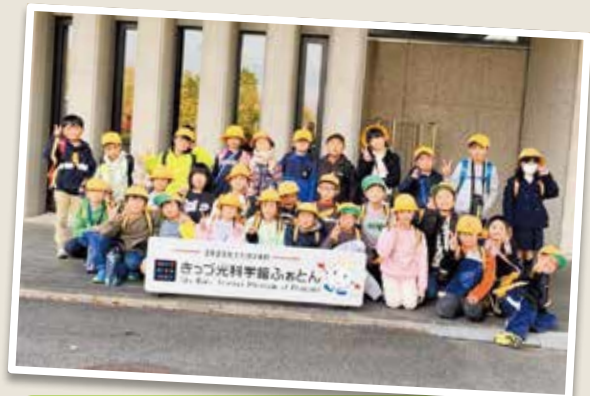
2年生 きつづ科学ふおとん・東大寺大仏殿