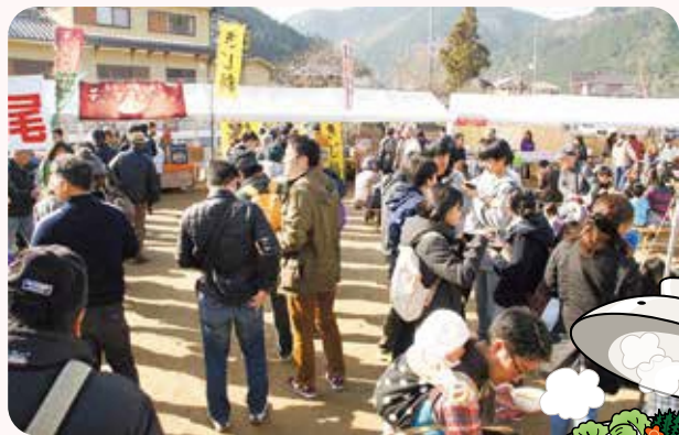
前回(令和元年)の様子

笠置に4年ぶり「鍋フェスタ」が復活します。令和6年1月28日(日)笠置いこいの館前特設会場にてひらきます。「笠置の食」をテーマにお馴染み「ご当地鍋」をはじめ、各地の自慢の鍋メニューが勢揃いです。地元食材の販売やグルメコーナー、近隣市町村からの「食の市」などを企画。「食文化発信コーナー」や「食」に関するクイズや参加型ゲーム、また、地元サークルのステージ発表やご当地キャラクターによるステージイベントなど盛りだくさんイベントを計画中。ご会場は公共交通機関をご利用ください。