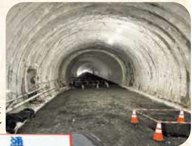
貫通した 鷲峰山トンネル