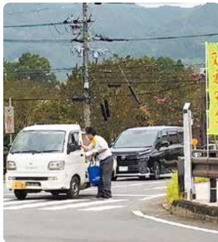
和束町：白栖橋交差点での啓発活動