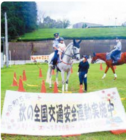
南山城村：平安騎馬隊による体験騎乗

道の駅の利用者に対して啓発物品の配布のほか、京都府警察平安騎馬隊とともに、交通安全マナーの向上を呼びかけました。