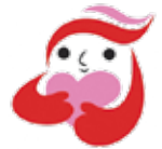
犯罪被害者等支援 シンボルマーク 「ギョっとちゃん」