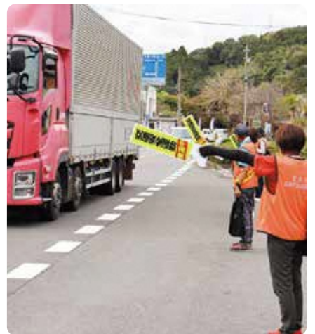
笠置町：国道163号での注意喚起